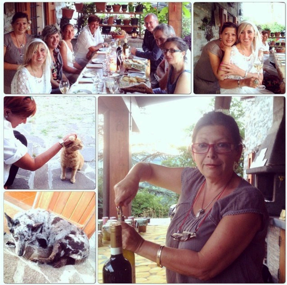
Cena inaugurale dell'Associazione Culturale Casa Rangoni