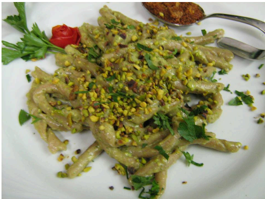
Busiati Trapanesi di semola tumminia al pesto di pistacchio e bottarga di tonno

Parliamo di olio extra vergine di oliva. Come dico spesso vorrei vedere sui tavoli dei ristoranti, come già avviene per i vini, delle 'carte degli oli d'oliva' con pillole informative che presentino brevemente le caratteristiche delle cultivar (varietà delle olive). Poi, mi piacerebbe che mi venisse proposta una piccola bottiglia d'olio d'oliva rappresentativa di un territorio che userei durante il pasto, pagherei nel conto a prezzo promozionale, e che mi porterei a casa. ?Utopia o speranza