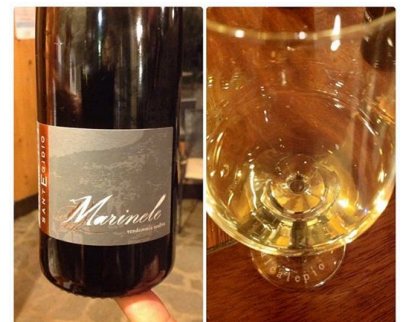
Moscato Giallo J.G.J. Sant'Egidio