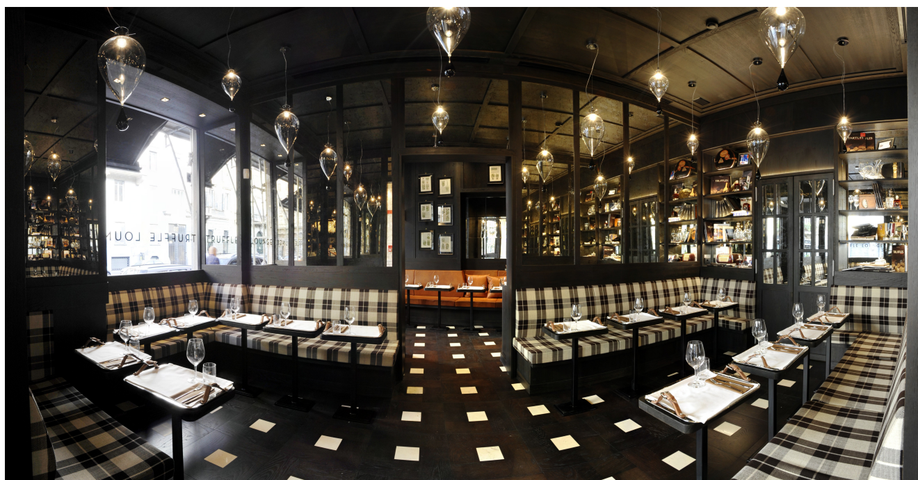
Tartufi & Friends Lounge

Corso Venezia, 18 – Milano www.tartufiandfriends.it