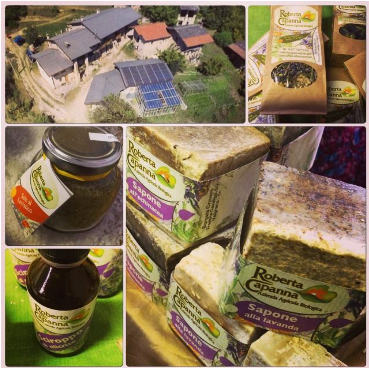
Azienda agricola biologica Roberta Capanna

Era tempo di tornare a casa. Uscendo le luci della sera su Genova mi hanno fatto fermare per un attimo attratta dal panorama... E' così che l'ho salutata.