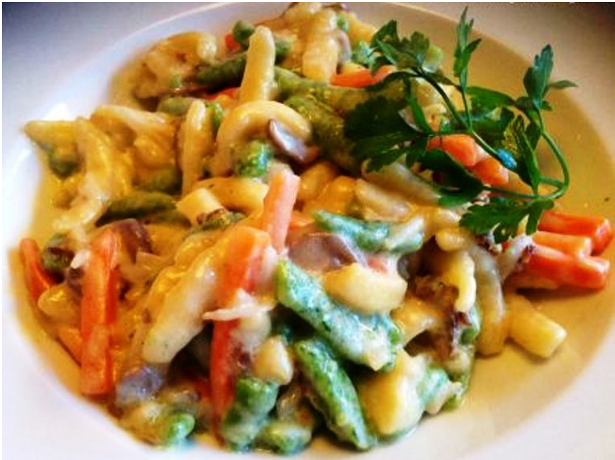
Spatzli con panna e verdure

.acqua. A volte, in sostituzione di quest'ultima, si utilizza la birra