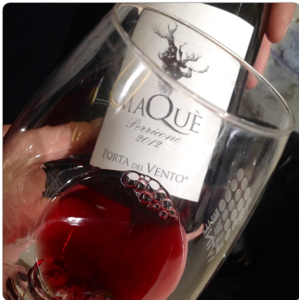
Maquè Perricone 2012 Porta del Vento – Camporeale (PA)

Apprezzo molto chi lo fa con me. Ma torniamo al vino... Perricone, un raro e antico vitigno autoctono siciliano, caratterizzato da grappoli a forma conica. Un vino poco conosciuto che nasce in una vallata ventosa in provincia di Palermo che ho apprezzato per il carattere.