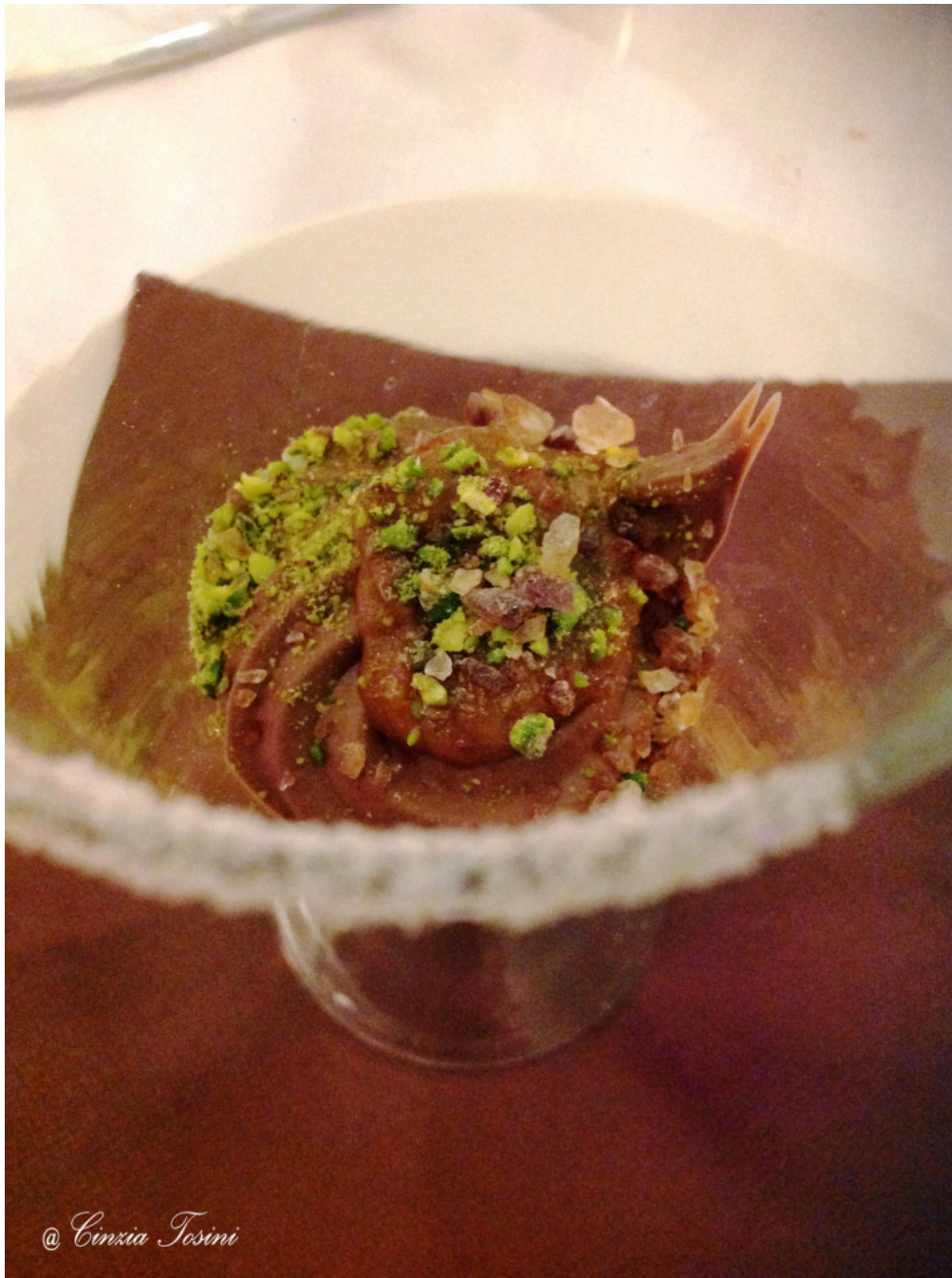
Mousse di cioccolato fondente con cristalli di zucchero integrali e salsa al mou