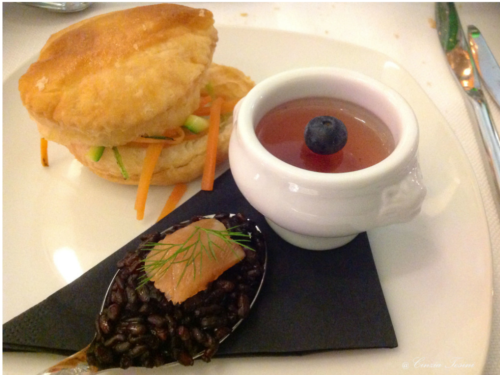
Sfogliatine calde alle verdure e crema. Timballo di riso nero con trancetto di salmone marinato. Gelatina di Nebbiolo con melograno