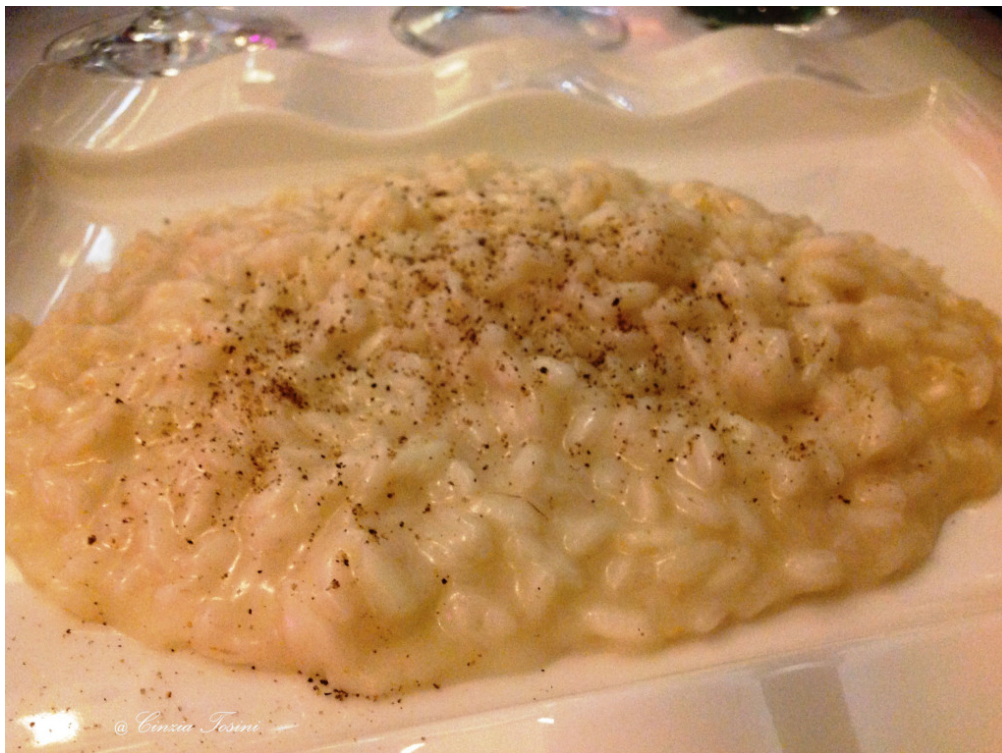
Risotto mantecato al Nebbiolo Rosé con dadi di Taleggio