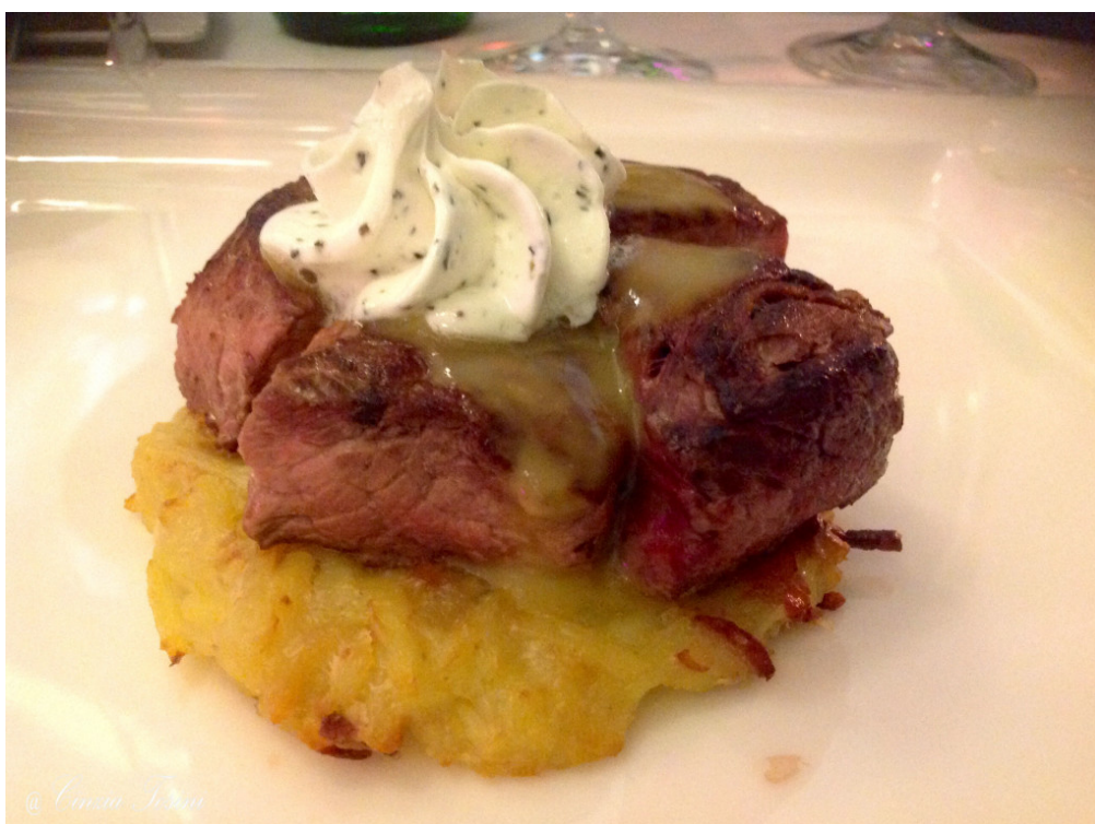
Timballo di controfiletto tiepido aromatizzato si crostone di patata alla pancetta croccante