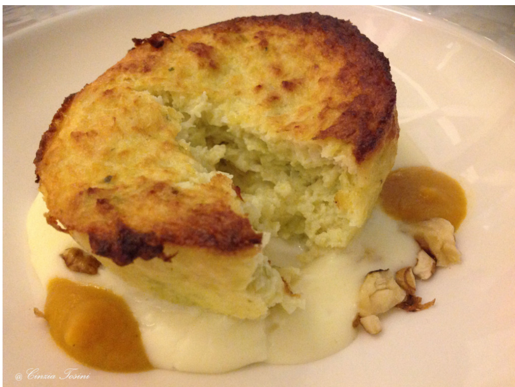
Fagottino di verza con fonduta alle noci e crema di zucca