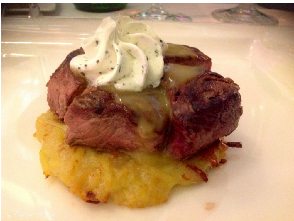
Timballo di controfiletto tiepido aromatizzato si crostone di patata alla pancetta croccante