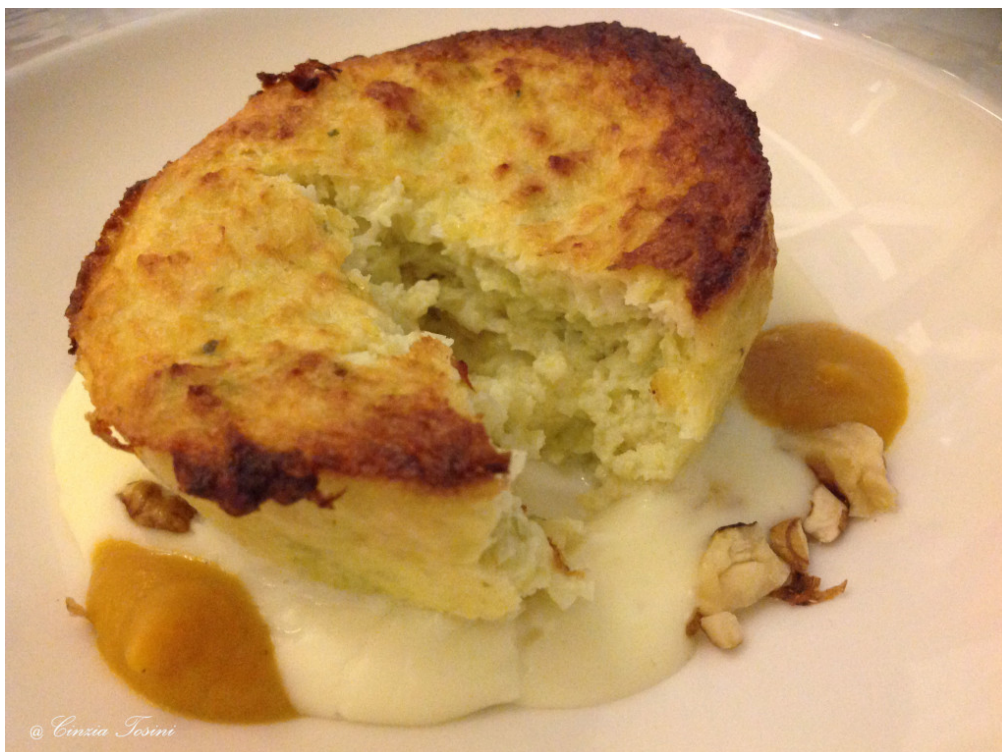
Fagottino di verza con fonduta alle noci e crema di zucca