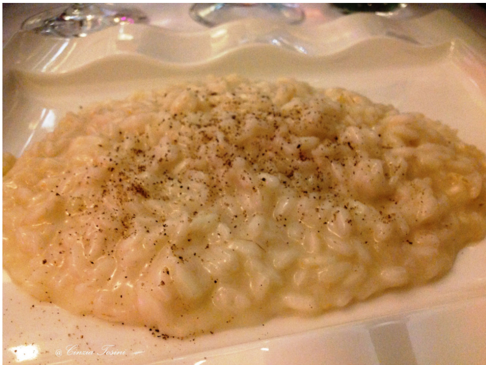
Risotto mantecato al Nebbiolo Rosé con dadi di Taleggio