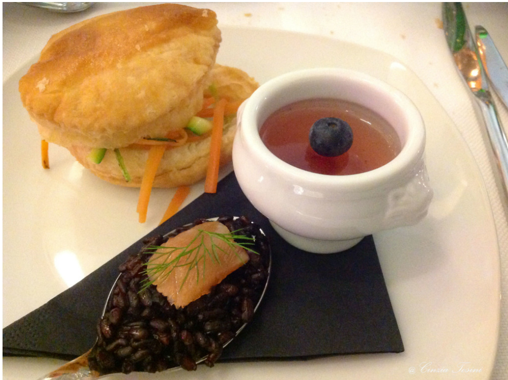
Sfogliatine calde alle verdure e crema. Timballo di riso nero con trancetto di salmone marinato. Gelatina di Nebbiolo con melograno