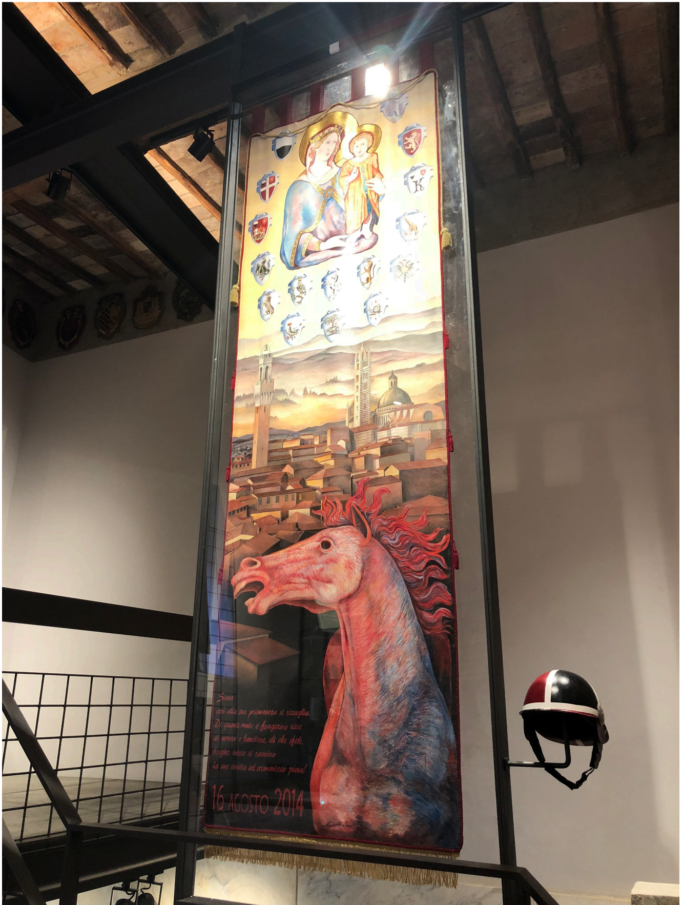
Museo Contrada della Civetta

Siena, un capolavoro dopo l'altro... Questa volta mi riferisco alla Ribollita . Un piatto tipico che si può assaggiare in una