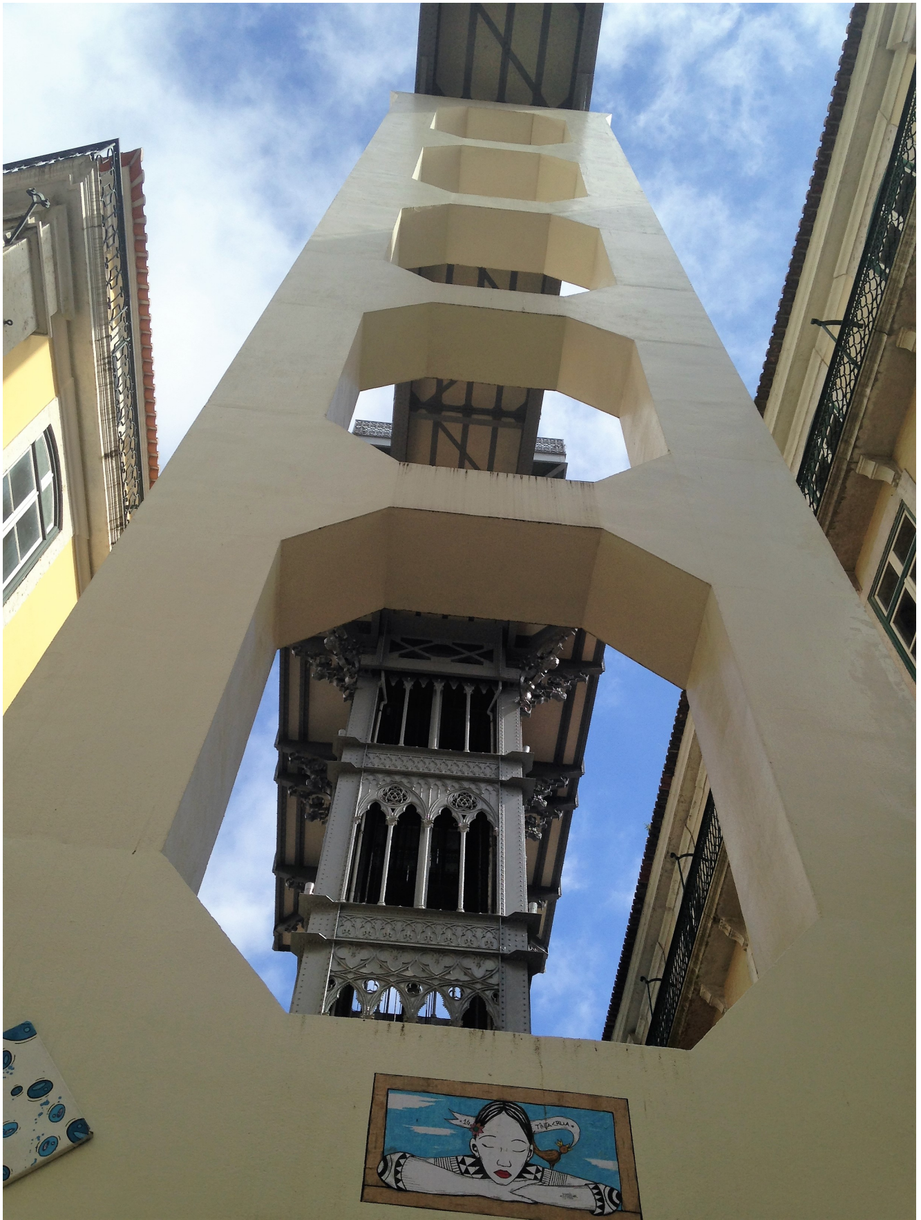
Centro di Lisbona