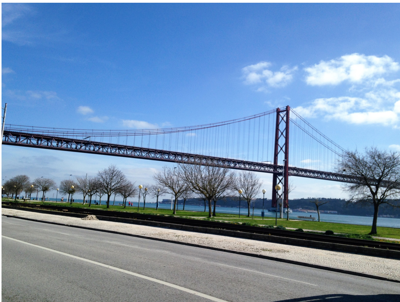
Ponte 25 de abril

tutto sconosciuta, e per lo più assente nelle guide e nelle indicazioni turistiche. Chi si vuole trasferire per ragioni economiche, deve avere una certa padronanza con la lingua inglese, e soprattutto, deve considerare l'eventualità di spostarsi nelle aree limitrofe della città, certamente meno care di Lisbona, ma più legate alle tradizioni locali.