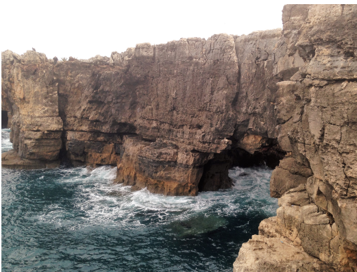
Info turistiche – Lisbona