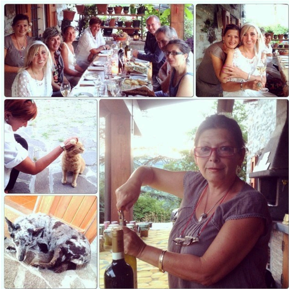
Cena inaugurale dell'Associazione Culturale Casa Rangoni