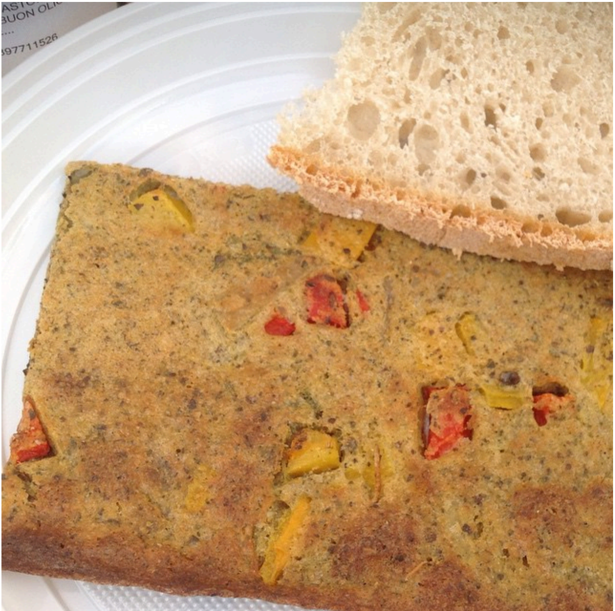
Farinata di ceci con verdura e semi di canapa