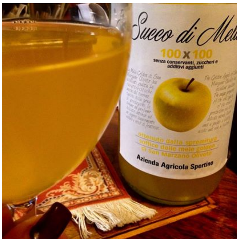
Succo di Mele Azienda Agricola Spertino