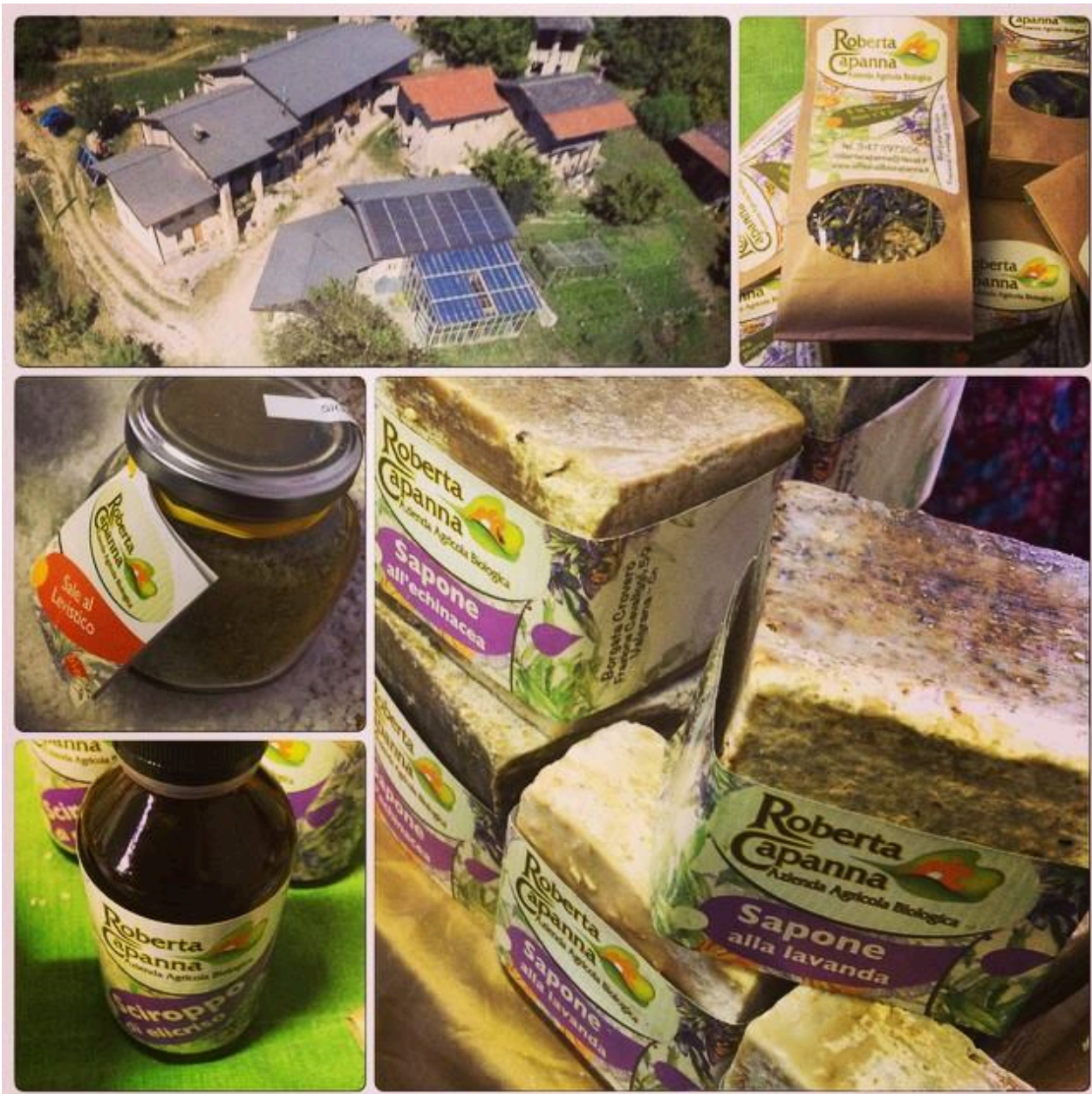
Azienda agricola biologica Roberta Capanna

Era tempo di tornare a casa. Uscendo le luci della sera su Genova mi hanno fatto fermare per un attimo attratta dal panorama... E' così che l'ho salutata.