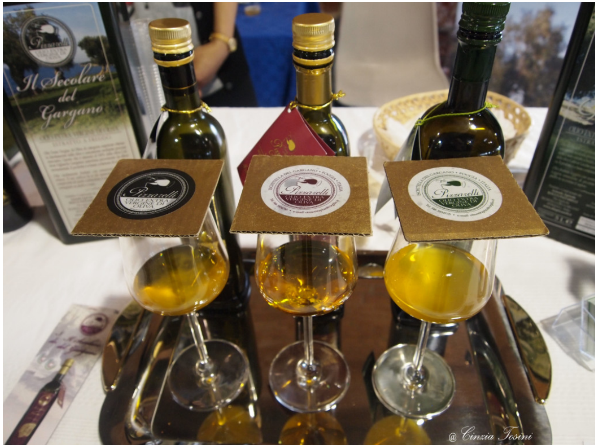
Azienda Agricola Pizzarelli Rocco – Ischitella del (Gargano (FG

Non poteva mancare l'aceto balsamico tradizionale di Modena. Per produrre quello VERO servono almeno dodici anni. L'aggettivo 'TRADIZIONALE' lo distingue dall'aceto industriale che possiamo acquistare a pochi euro. Questo è quello prodotto dal Centro di Terapia La Lucciola, un'Associazione O.N.L.U.S. per l'aiuto dell'infanzia in .(difficoltà a Stuffione di Ravarino (MO