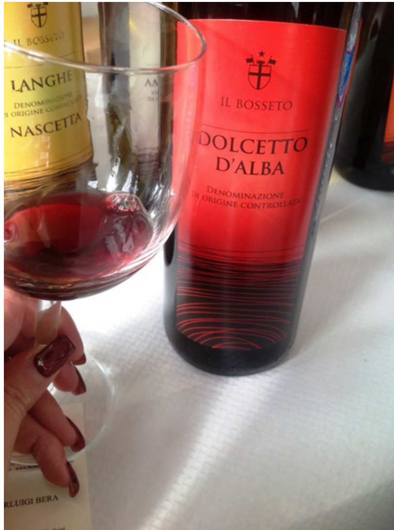
'Dolcetto d'Alba 'Il Bosseto

Come si suol dire... non si beve a stomaco vuoto. In effetti ho rimediato subito con un trancio di Farinata di ceci con verdura e semi di canapa . Questi semi sono ricchi di omega 3 e omega 6, e per questo un ottimo rimedio per contrastare il .colesterolo LDL (quello cattivo) e i disturbi cardiovascolari