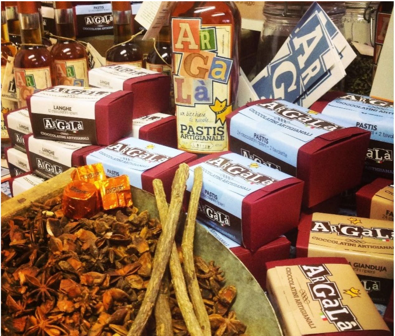
Pastis artigianale Argalà

Passeggiando tra gli stand ho visto cassette colme di mele gialle. Adorando la frutta ne ho chiesta una, e così ho fatto merenda. Una mela del frutteto dall'azienda agricola Spertino di San Marzano Oliveto, nel Monferrato. Una realtà familiare di cinque ettari che produce un ottimo succo di mele senza .aggiunta di zuccheri, conservanti ne additivi