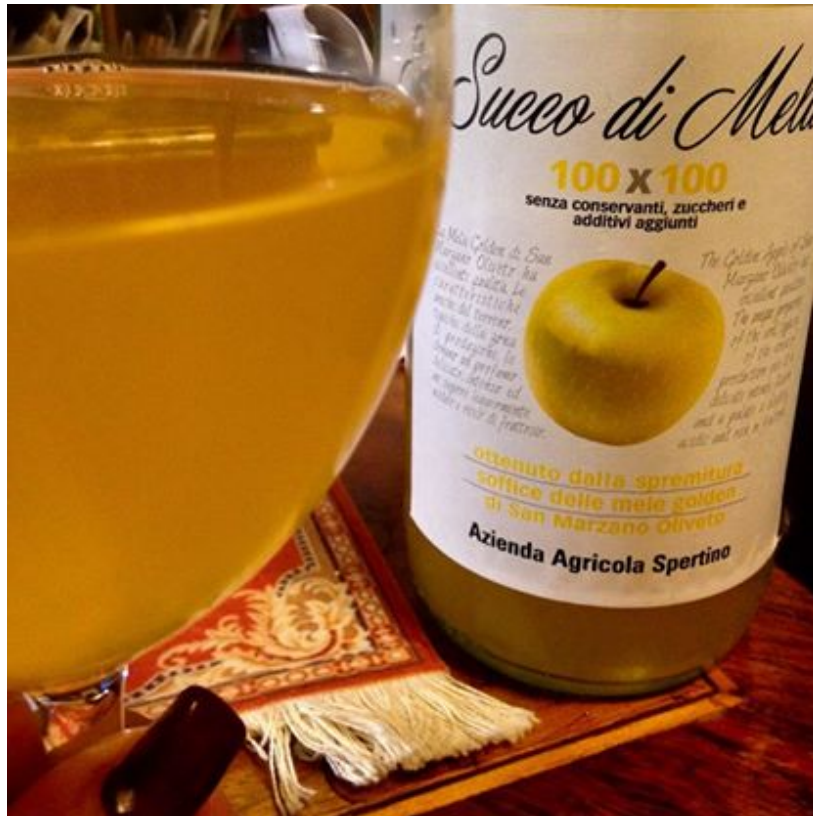
Succo di Mele Azienda Agricola Spertino