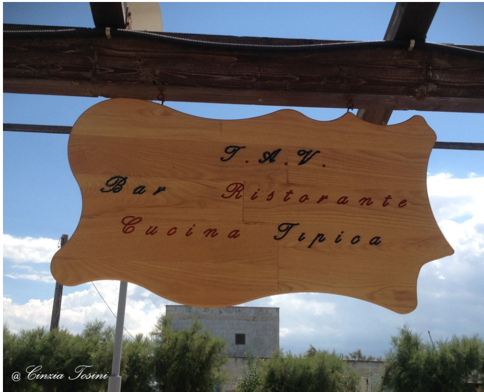
Ristorante da Ninì T.A.V. – Viale delle (Tamerici, Specchiolla – Carovigno (BR

Un legume tra i più antichi che si può utilizzare fresco o secco. E' una buona fonte di fosforo, ferro, zinco, magnesio .e vitamina E