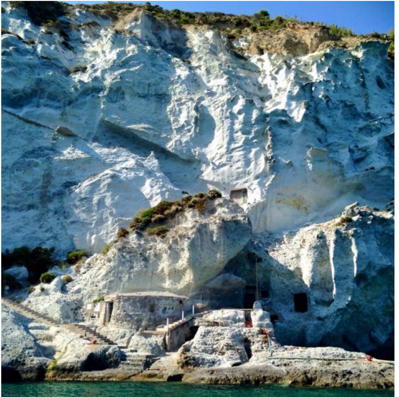
Subito dopo il porto appaiono maestose le grotte di Pilato , l'antico Murenario romano risalente al I secolo a.C.