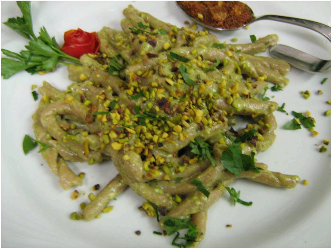
Busiati Trapanesi di semola tumminia al pesto di pistacchio e bottarga di tonno

Parliamo di olio extra vergine di oliva. Come dico spesso vorrei vedere sui tavoli dei ristoranti, come già avviene per i vini, delle 'carte degli oli d'oliva' con pillole informative che presentino brevemente le caratteristiche delle cultivar (varietà delle olive). Poi, mi piacerebbe che mi venisse proposta una piccola bottiglia d'olio d'oliva rappresentativa di un territorio che userei durante il pasto, pagherei nel conto a prezzo promozionale, e che mi porterei a casa. ?Utopia o speranza