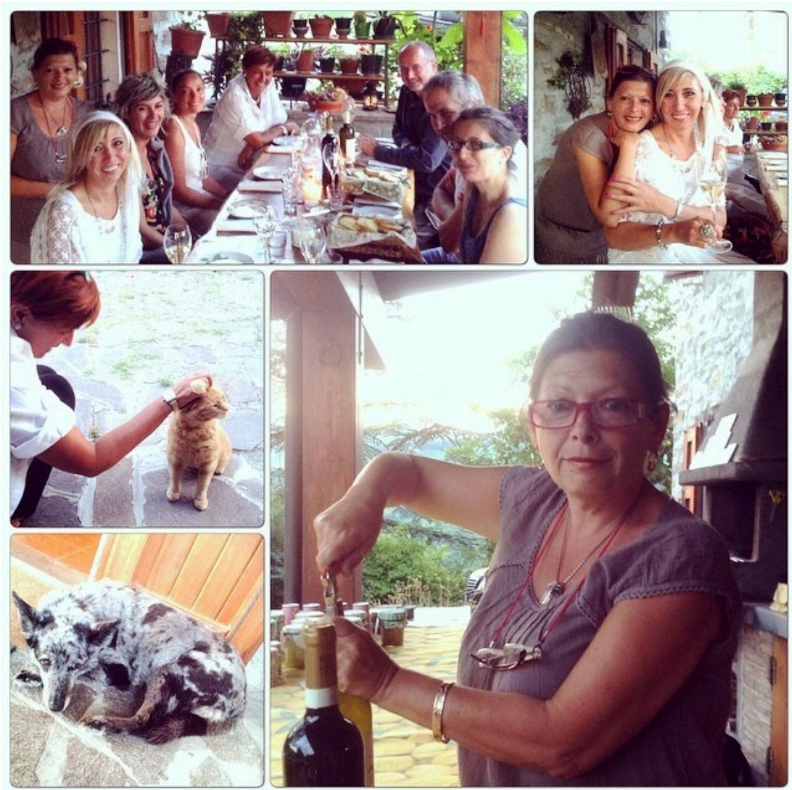
Cena inaugurale dell'Associazione Culturale Casa Rangoni