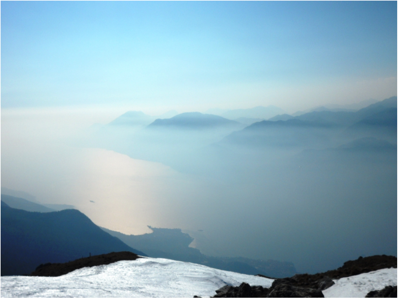
Monte Baldo a quota 1.800 metri