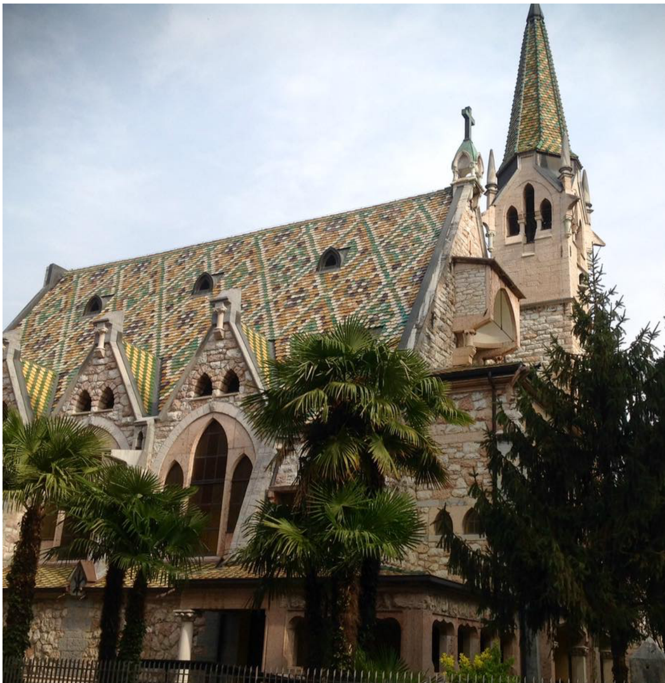
Chiesa Evangelica della Trinità – Arco

costruita nel 1897 in stile neogotico. Entrando, mi si è avvicinato un pastore con un sorriso e con un classico "Good morning!" Ormai sono abituata ad essere scambiata per una turista inglese, mi succede spesso, soprattutto quando passeggio a Venezia. Finita la mia visita in quel bel luogo di pace, ci siamo salutati con un sorriso, e con un immancabile "Buongiorno!"