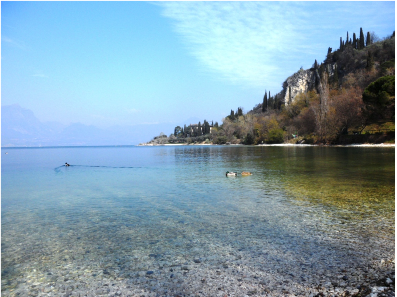
Baia delle sirene