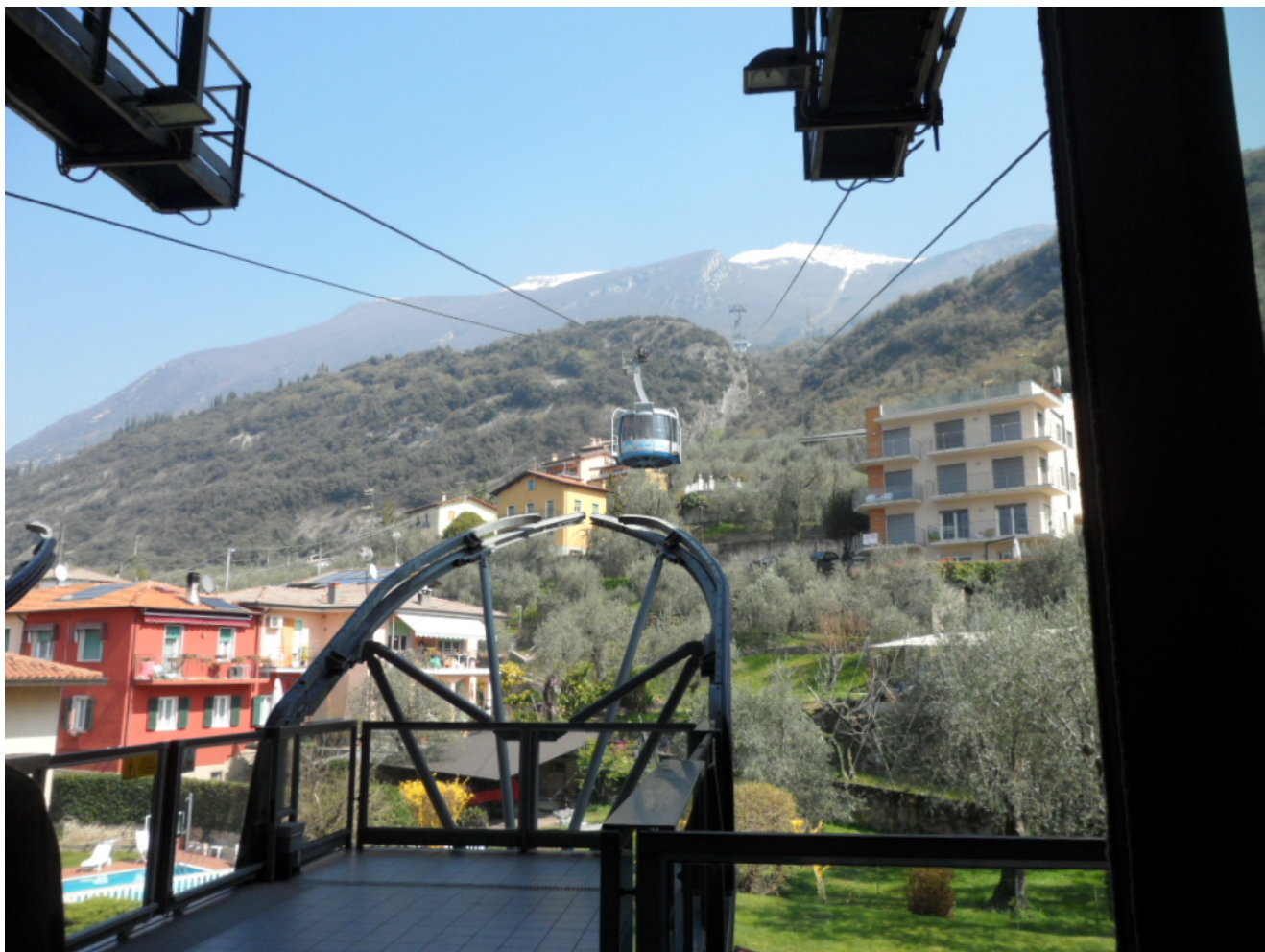
Funivia Malcesine – Monte Baldo

giorni, con inizio alle 8,00 fino alle ore 18.45 (ultima corsa dal Monte Baldo).