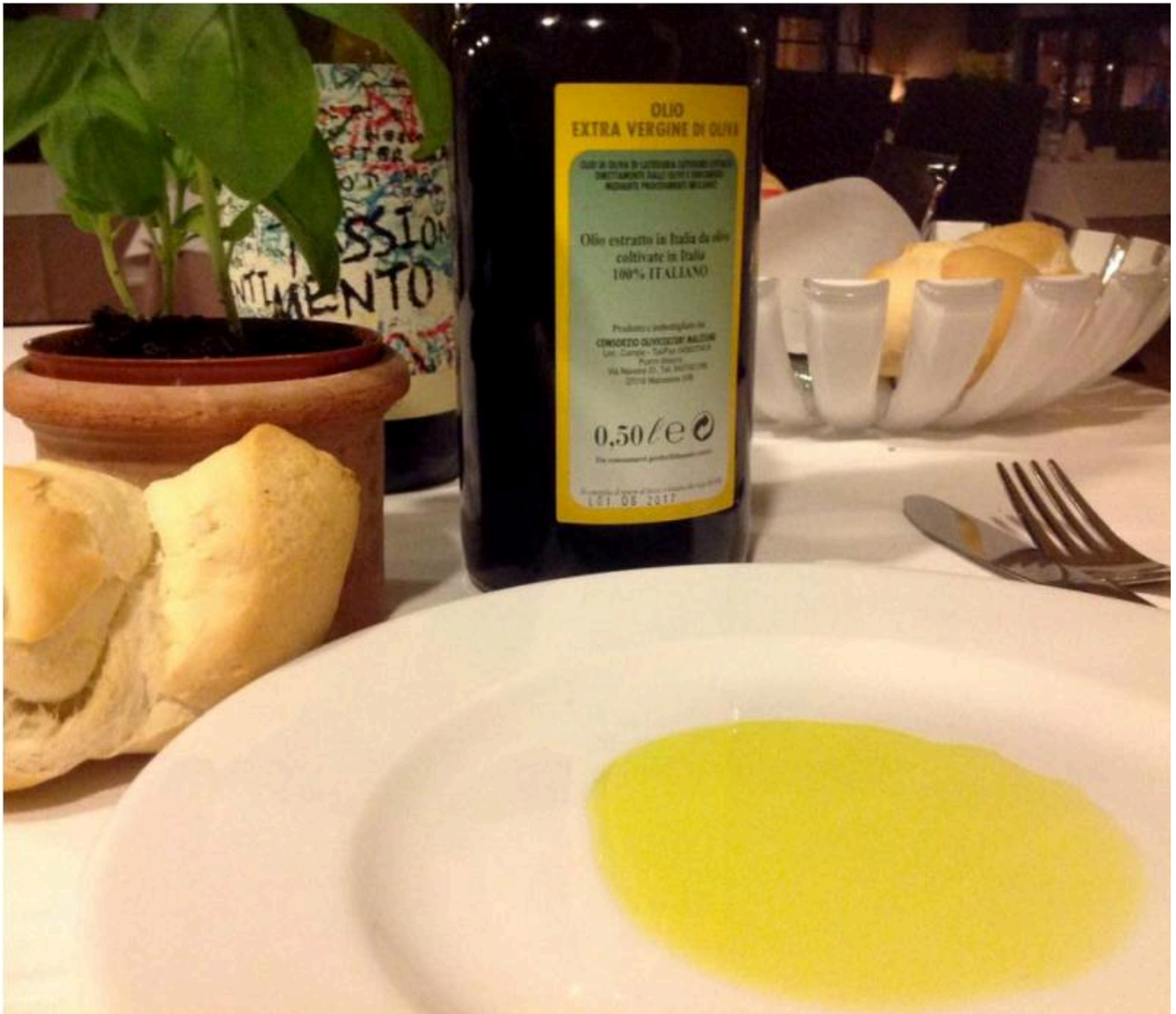
Olio Extra Vergine di Oliva del Consorzio Olivicoltori di Malcesine