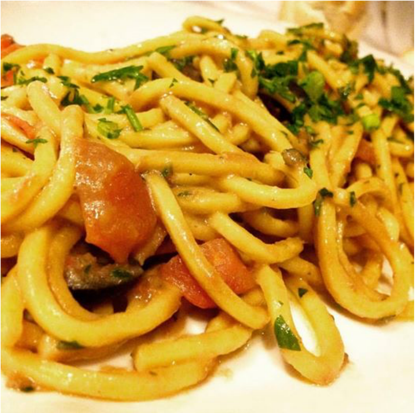
Bigoli con le sarde

Quella sera, con piacere, ho assaggiato un calice di Garganega 'Romeo & Juliet' 2014 della Famiglia Pasqua vigneti e cantine . Un antico vitigno a bacca bianca molto diffuso nel Veneto. Un vino con un'etichetta dedicata ad una storia d'amore. Uno scatto di Giò Martorana , premio Unesco per la fotografia, che ripropone i messaggi che ogni giorno gli innamorati scrivono sulle pareti del cortile della casa di Giulietta a Verona.