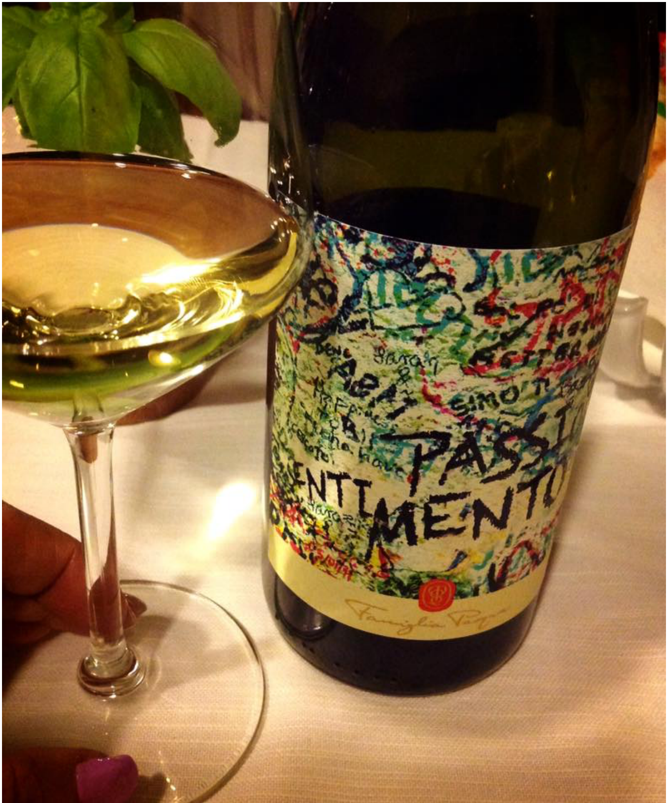
Garganega 'Romeo & Juliet' 2014 – Pasqua vigneti e cantine