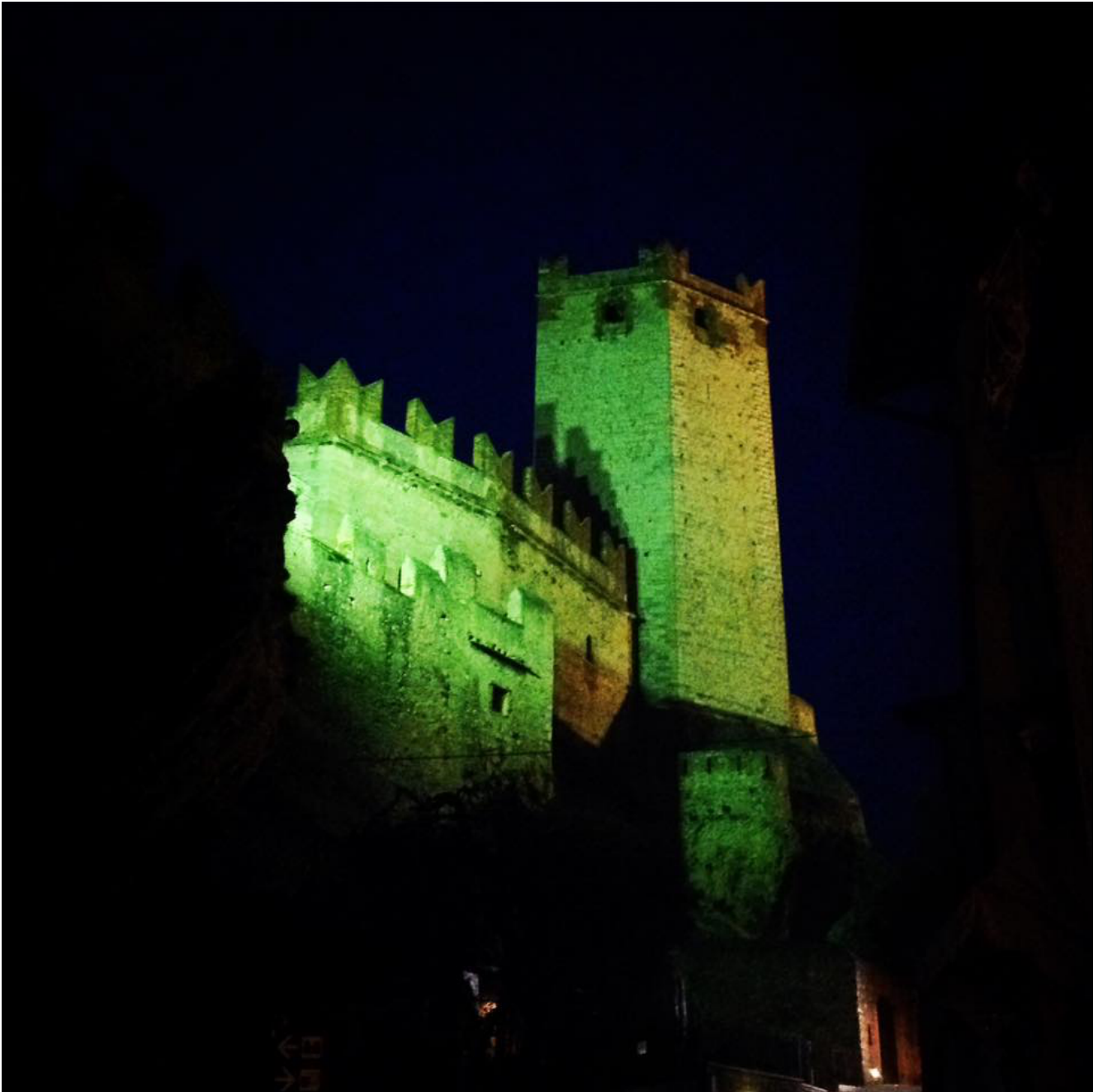
Castello Scaligero di Malcesine