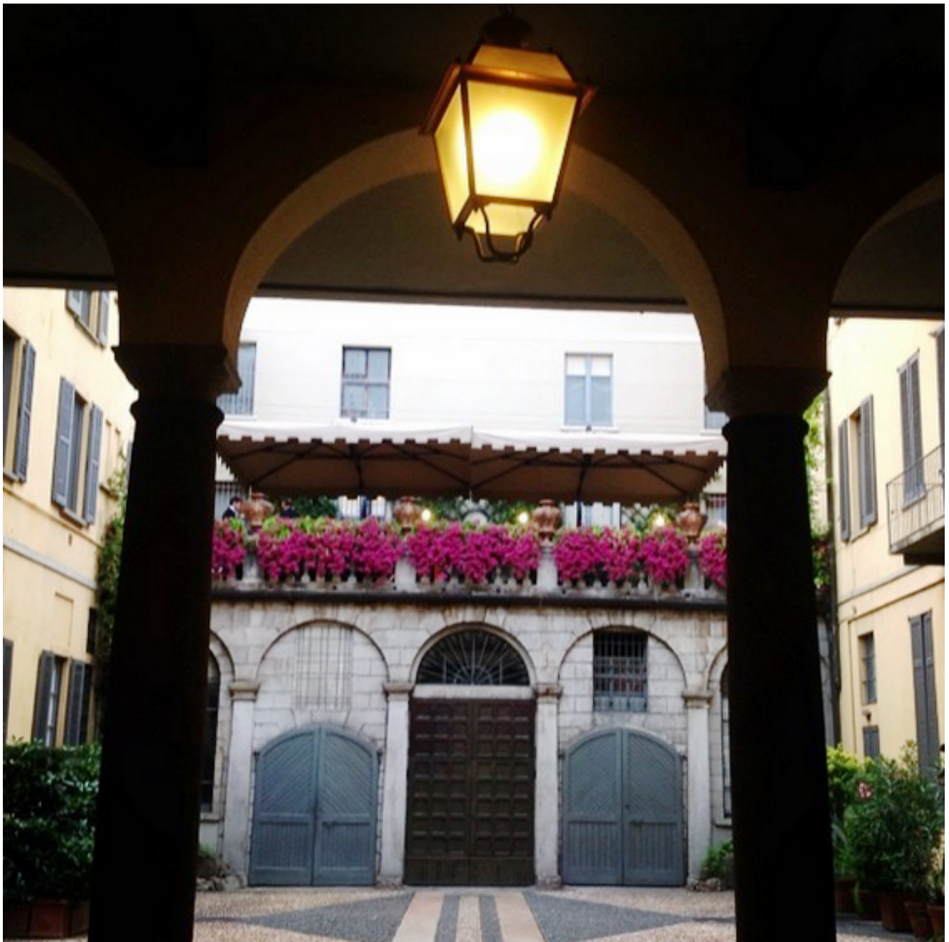
Ristorante 'Cavoli a Merenda'

conosciuto in America, è un vino di una Maison francese che si distingue per la capacità riconosciuta di fare squadra. Un'attitudine oltre che un'inclinazione, che nel tempo favorisce le economie e il territorio.