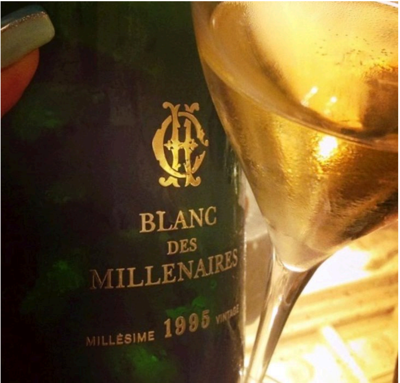
Blanc Des Millenaires Millésime 1995 Vintage – Charles Heidsieck