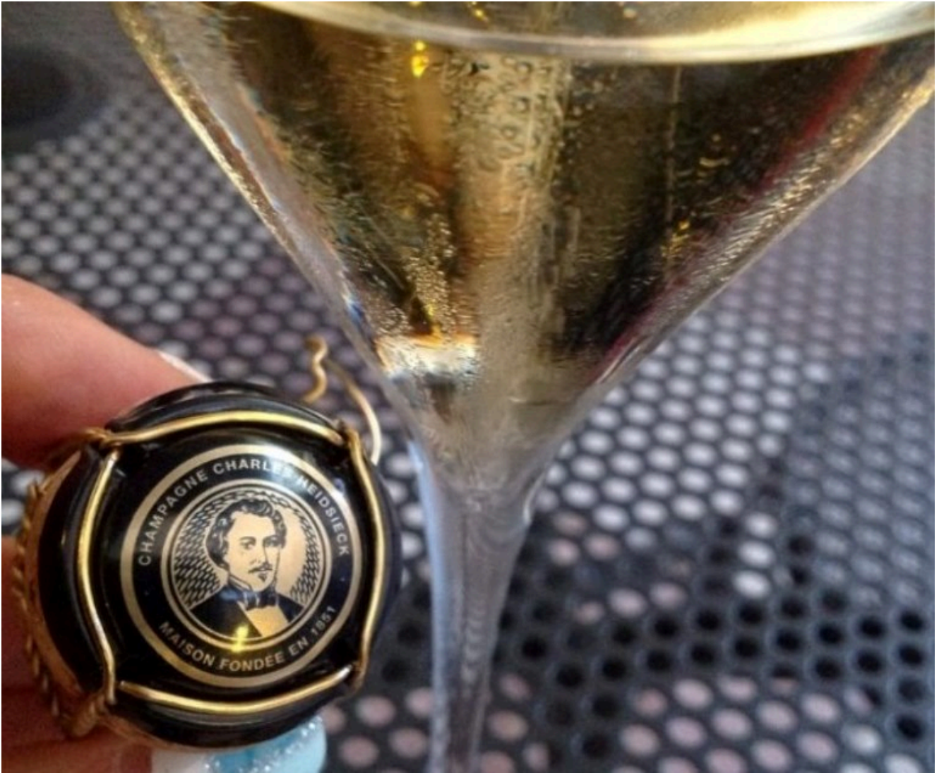
Champagne Charles Heidsieck

Ebbene, qualche sera fa ho colto l'invito di Philharmonica, realtà distributiva di produzioni selezionate, partecipando ad una cena dedicata a questo champagne prodotto da una Maison storica nata nel 1851.