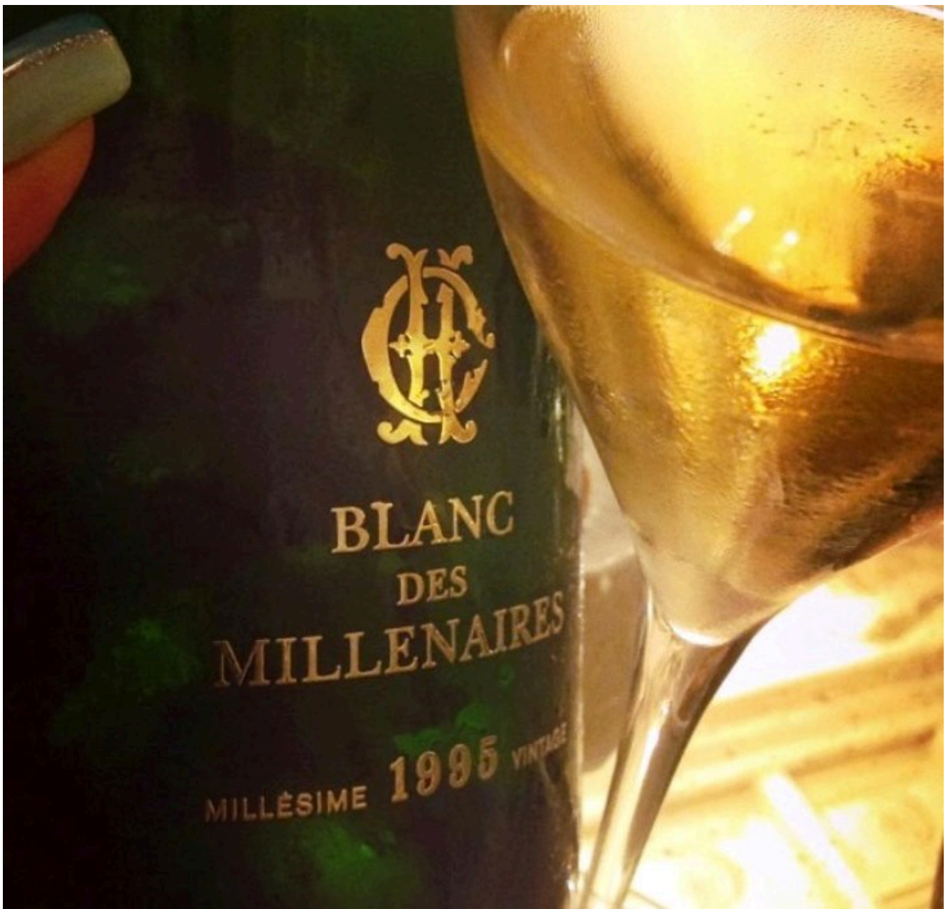
Blanc Des Millenaires Millésime 1995 Vintage – Charles Heidsieck