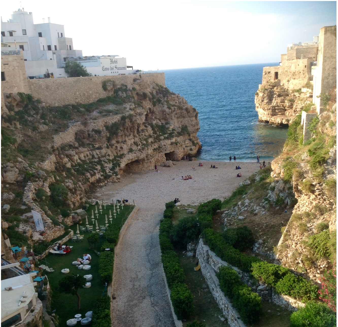
La Scogliera di Polignano a Mare

Mentre viaggio mi piace condividere in rete foto e pensieri. E' così che le persone che mi seguono nei miei itinerari, oltre a trasmettermi il calore e la nostalgia dei paesi che per necessità hanno dovuto lasciare, mi consigliano e mi indirizzano. Un modo più intenso di vivere il viaggio