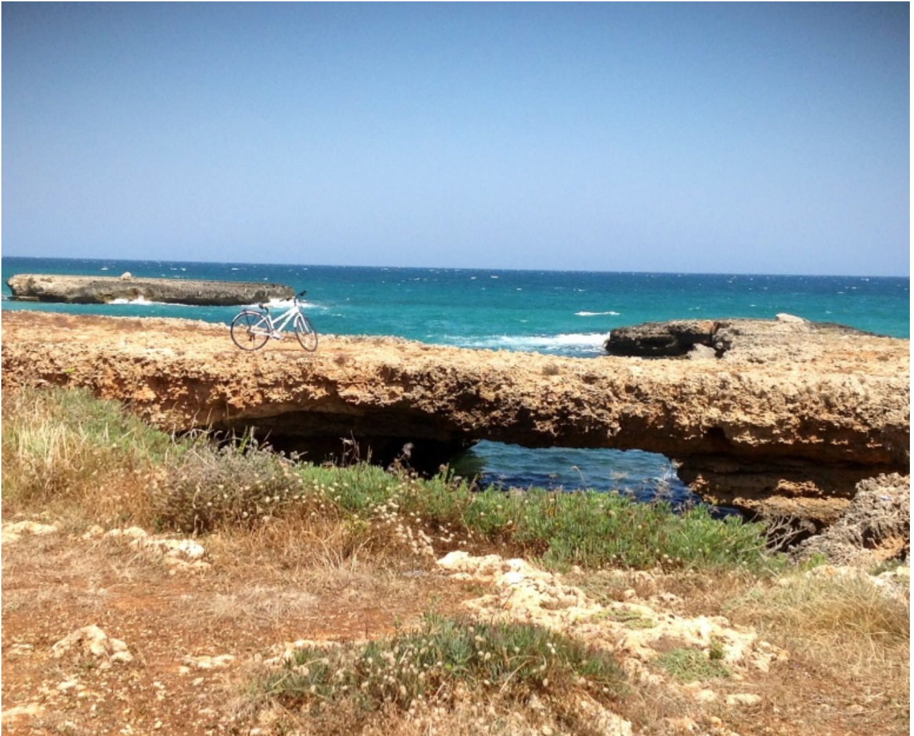
Torre Santa Sabina

In questi giorni ho rivisto vecchi amici, e ne ho incontrato di nuovi. Molte le emozioni, come il giorno in cui, nel mare di Taranto, durante un giro in barca un'improvvisa burrasca mi .ha fatto capire quanto possa essere forte e impetuoso il mare