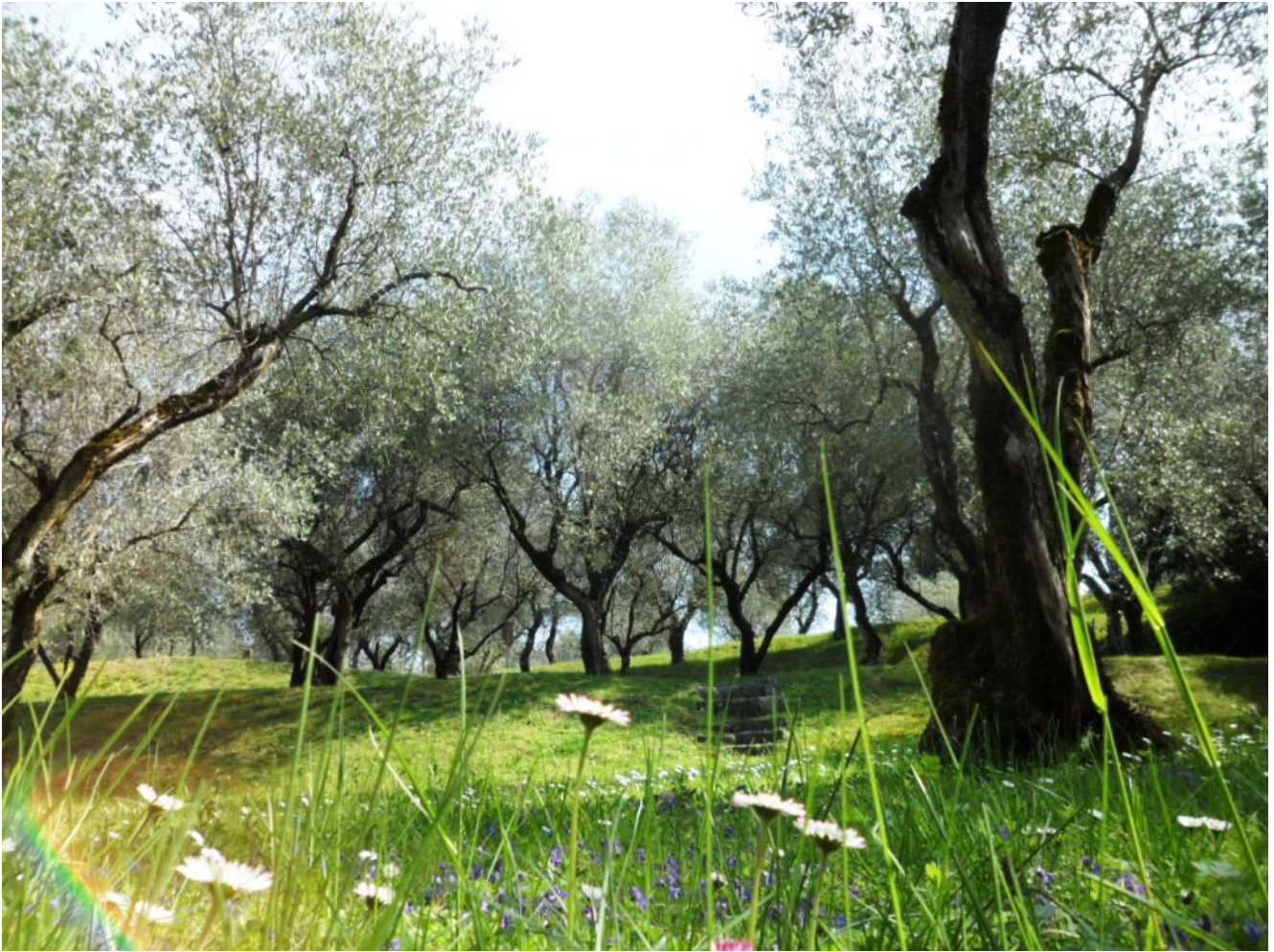
Ulivi del Parco Baia delle Sirene

Ci sono ulivi ovunque lungo le strade del Garda. Una terra di olio d'oliva garantito dal 1997 con la DOP "Garda" a tutela della provenienza e delle caratteristiche organolettiche. A Malcesine, grazie alla cultivar Casaliva , al tipo di terreno e al clima fresco, si produce un olio a bassissima acidità. Merito di ben 550 piccoli produttori uniti nel Consorzio Olivicoltori Malcesine , una società nata nel 1946. Circa 7-8.000 quintali di olio extra vergine di oliva prodotto per l'autoconsumo e per i punti vendita del Consorzio. Un olio .delicato dai profumi fruttati