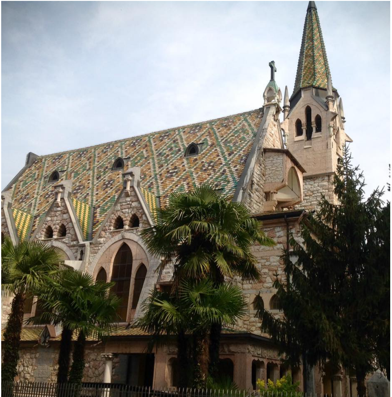
Chiesa Evangelica della Trinità – Arco

costruita nel 1897 in stile neogotico. Entrando, mi si è avvicinato un pastore con un sorriso e con un classico "Good morning!" Ormai sono abituata ad essere scambiata per una turista inglese, mi succede spesso, soprattutto quando passeggio a Venezia. Finita la mia visita in quel bel luogo di pace, ci siamo salutati con un sorriso, e con un immancabile "! "Buongiorno