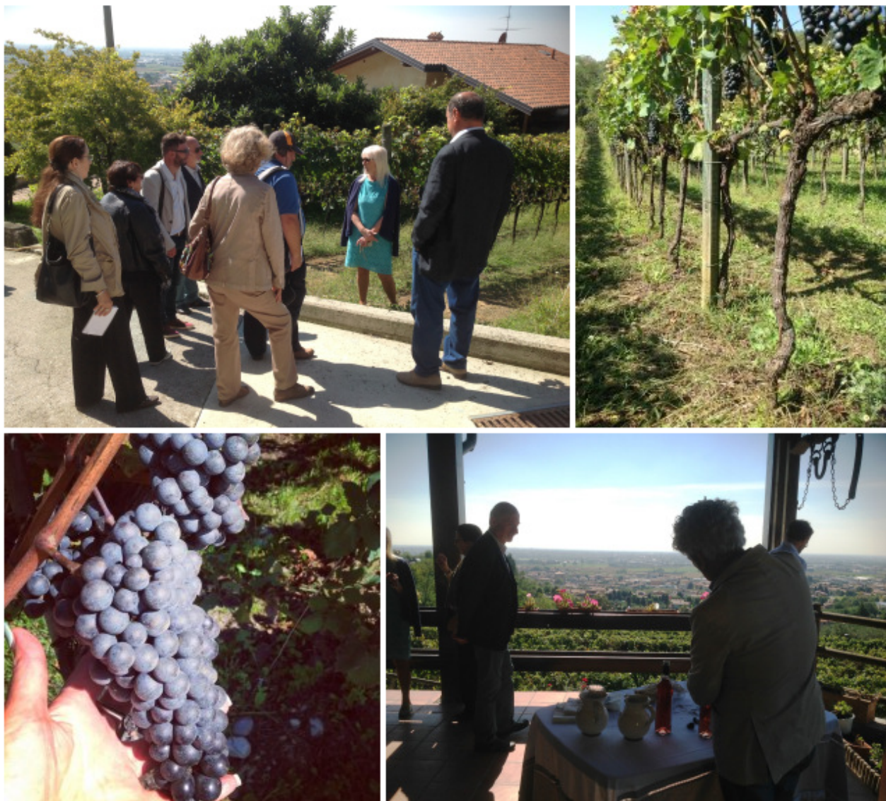
Tenuta Le Mojole