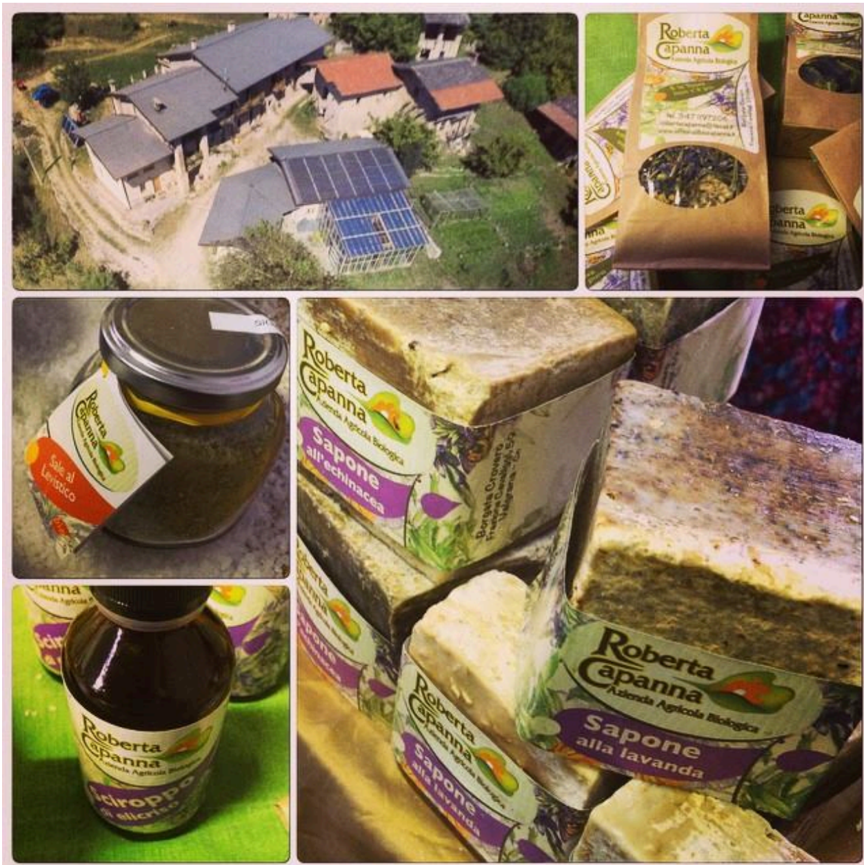
Azienda agricola biologica Roberta Capanna

Era tempo di tornare a casa. Uscendo le luci della sera su Genova mi hanno fatto fermare per un attimo attratta dal panorama... E' così che l'ho salutata.