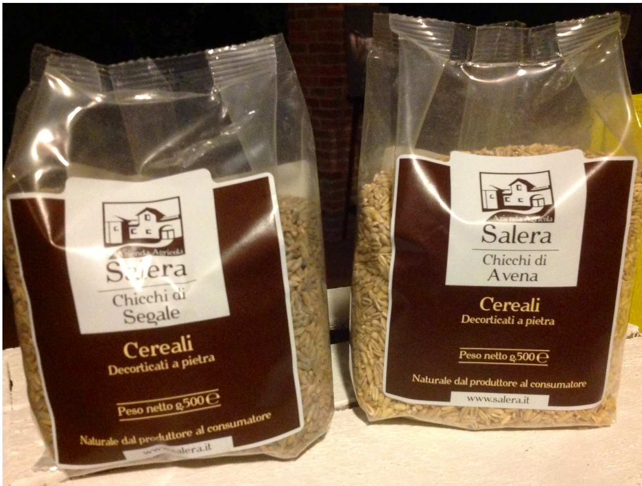
(Azienda Agricola Salera a Garlasco (PV