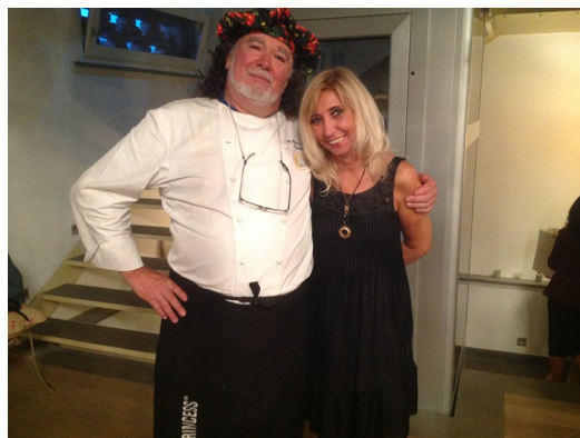
...Cibo ma anche vino