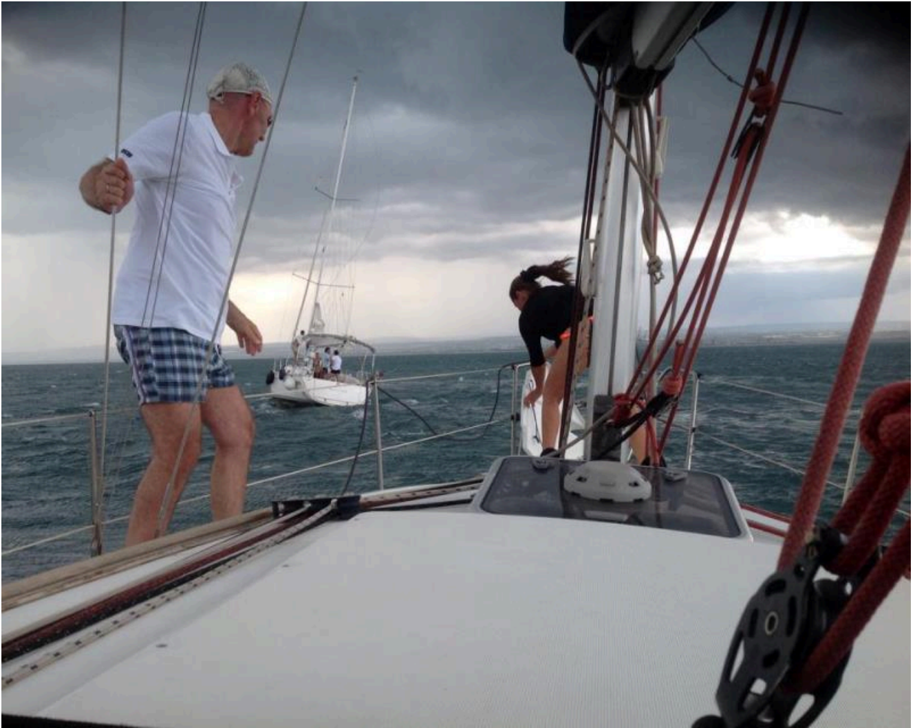
Mare in burrasca – Molo Sant'Eligio (Marina Taranto)

Passata la burrasca non mi sono fatta mancare delle friselle all'acqua di mare preparate come una volta facevano i pescatori salentini.