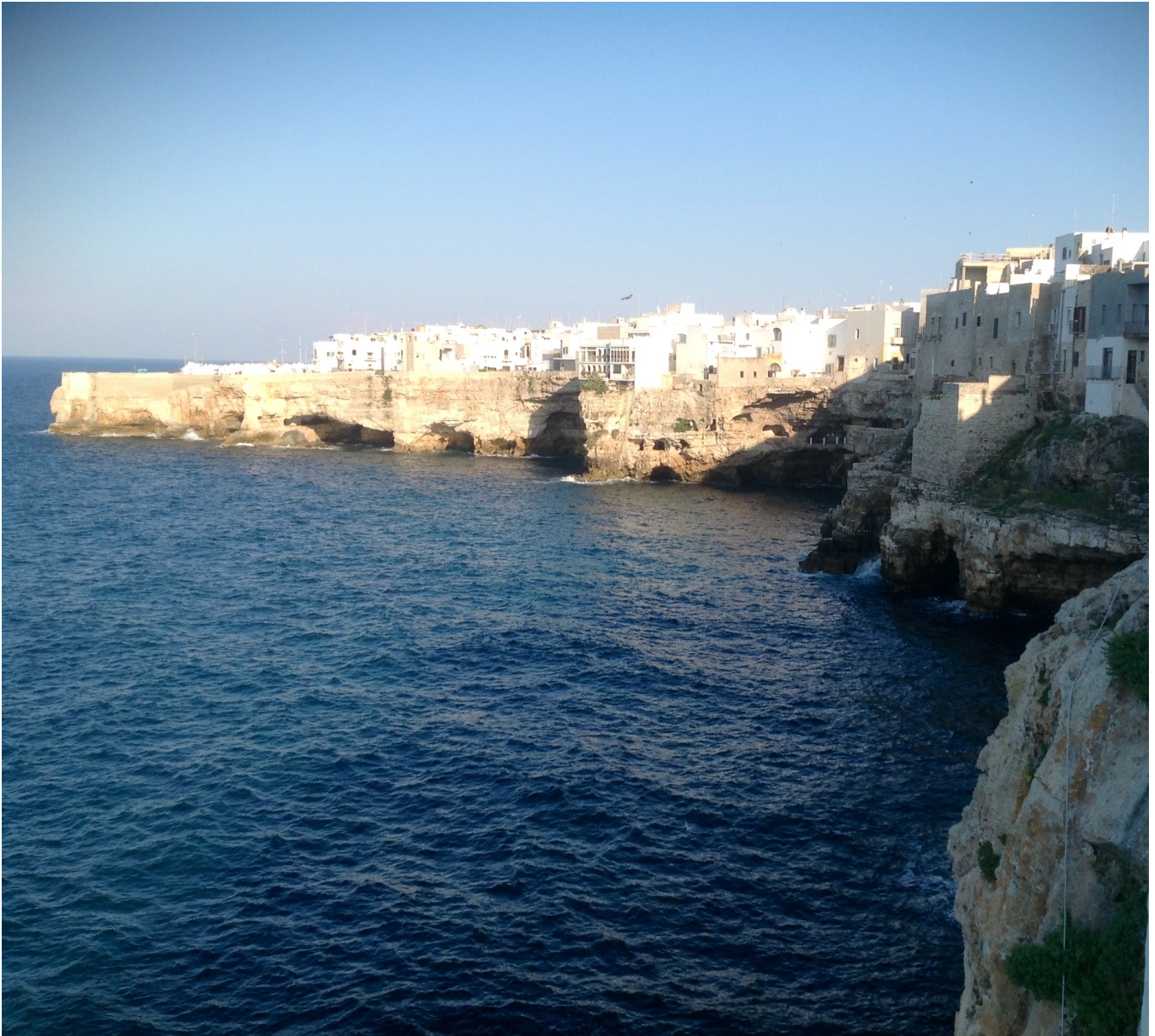
Polignano a Mare