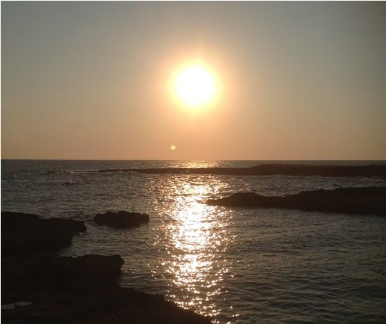
L'alba a Torre Santa Sabina