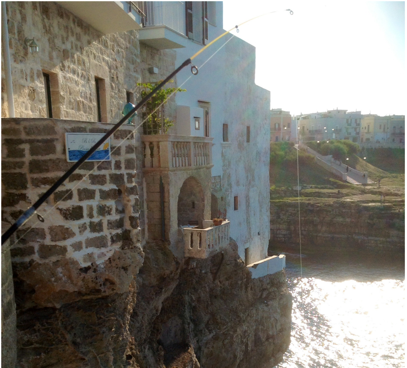
Uno scorcio di Polignano a Mare