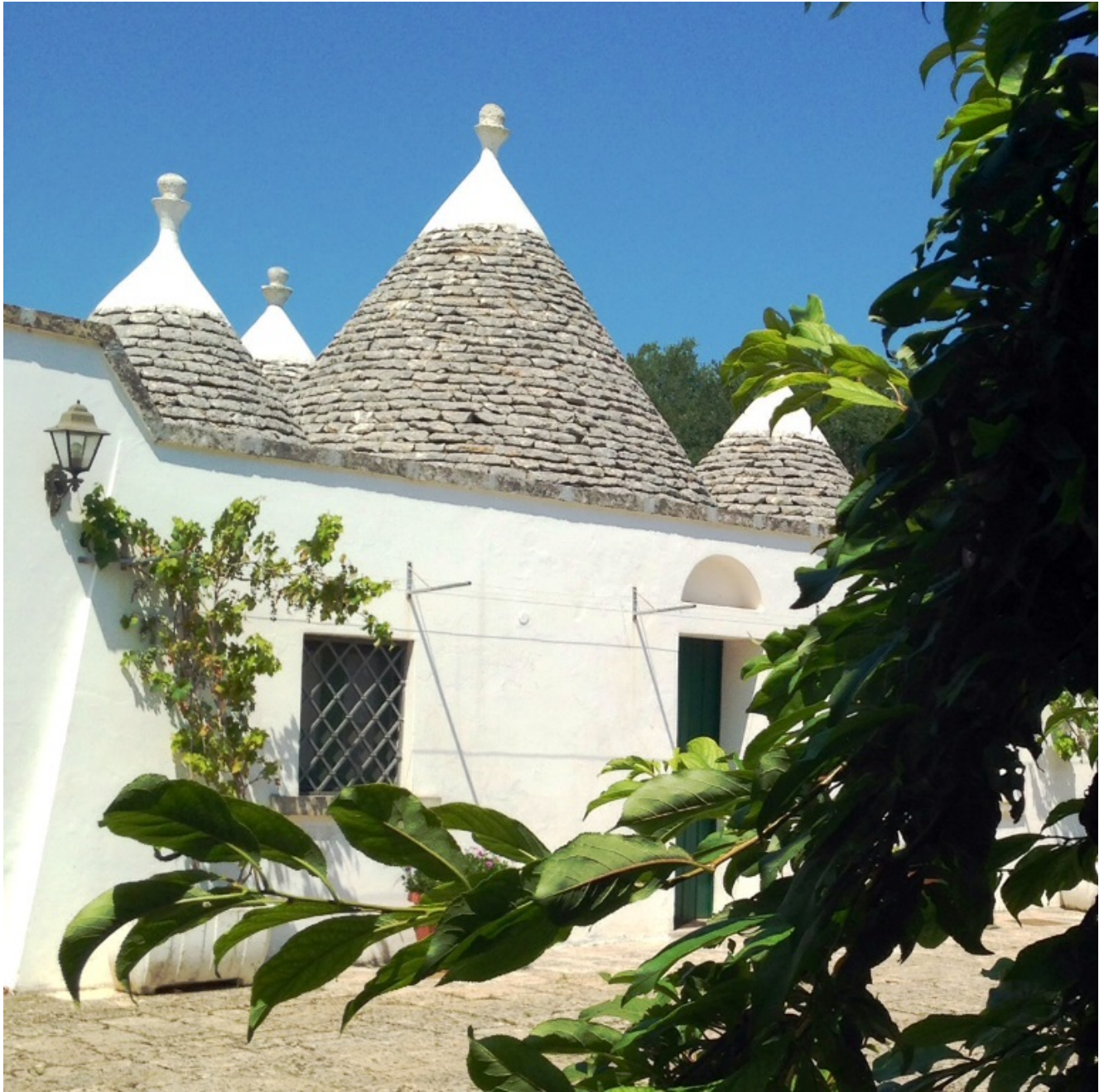
Trullo a San Michele Salentino