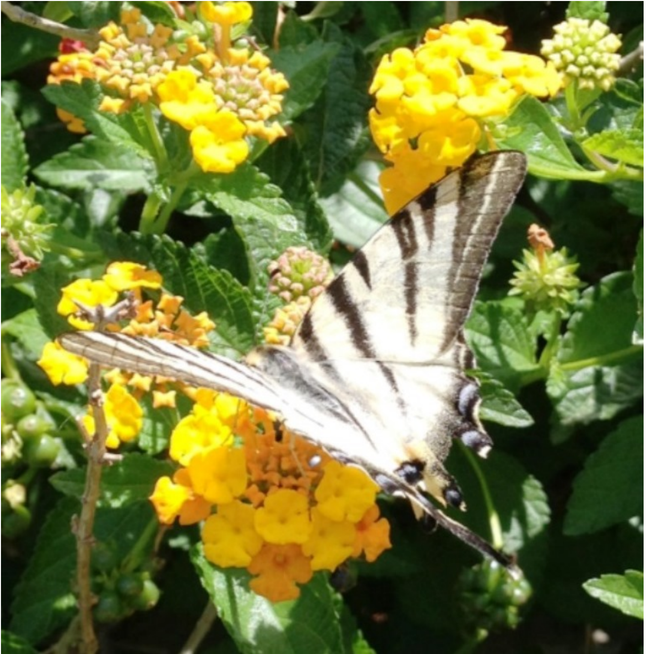
La pianta delle farfalle