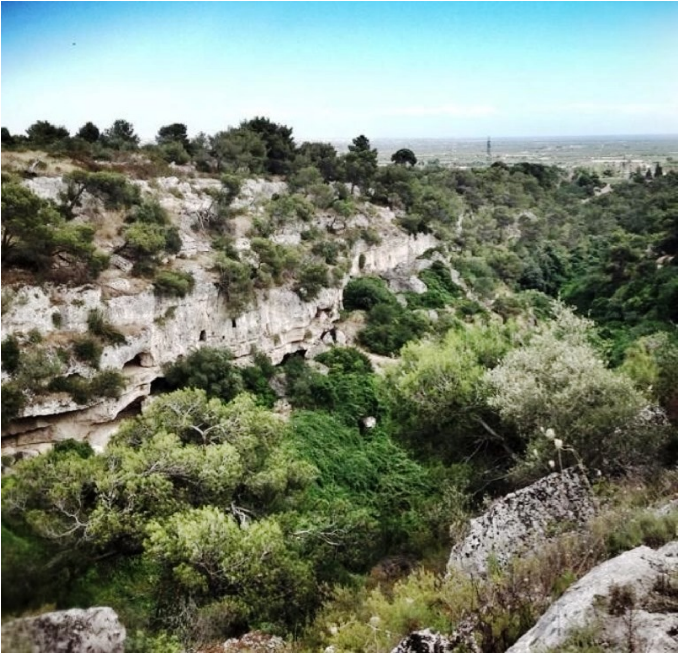
Gravina di Mottola