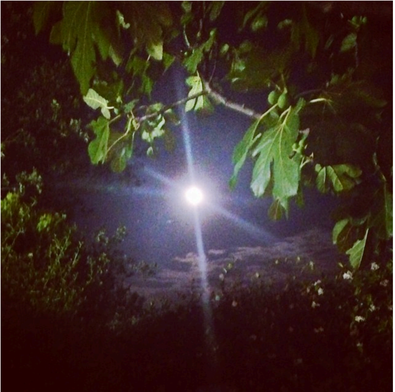
La luna dai riflessi d'argento a Carovigno