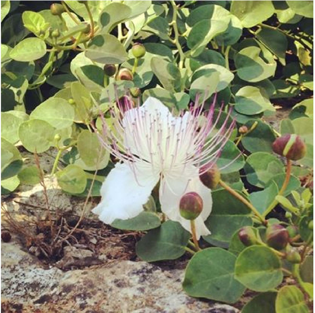
Fiore di cappero