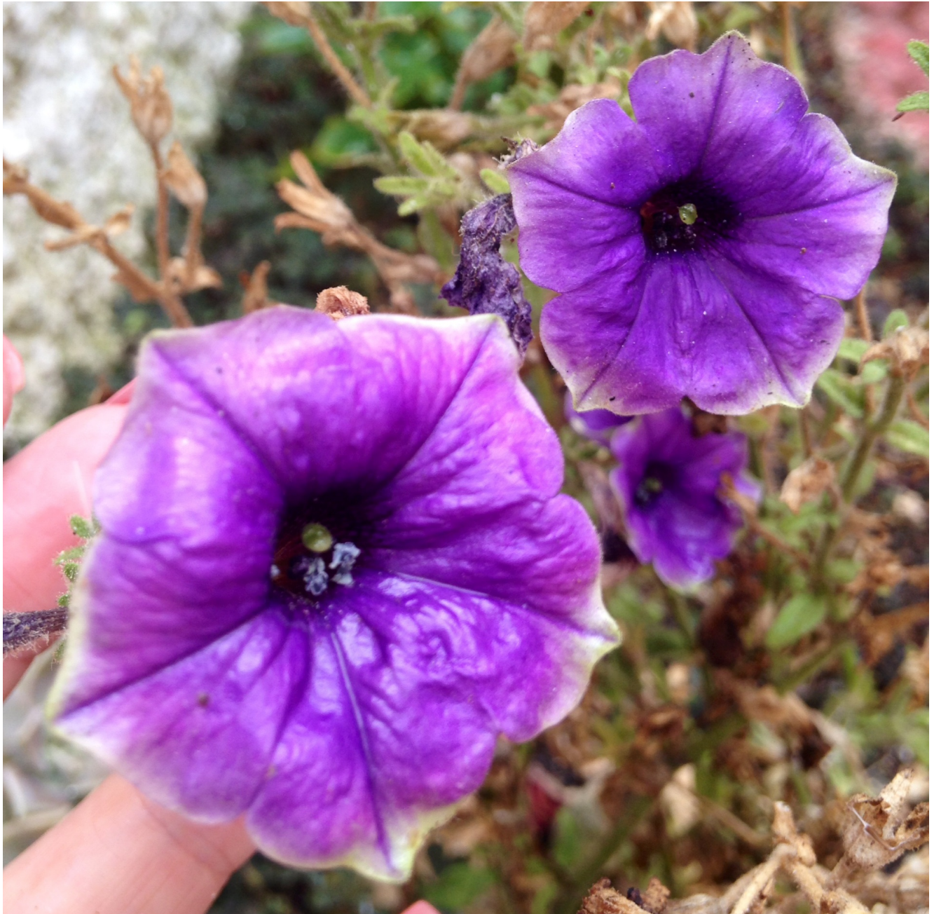
Fiori di Brindisi