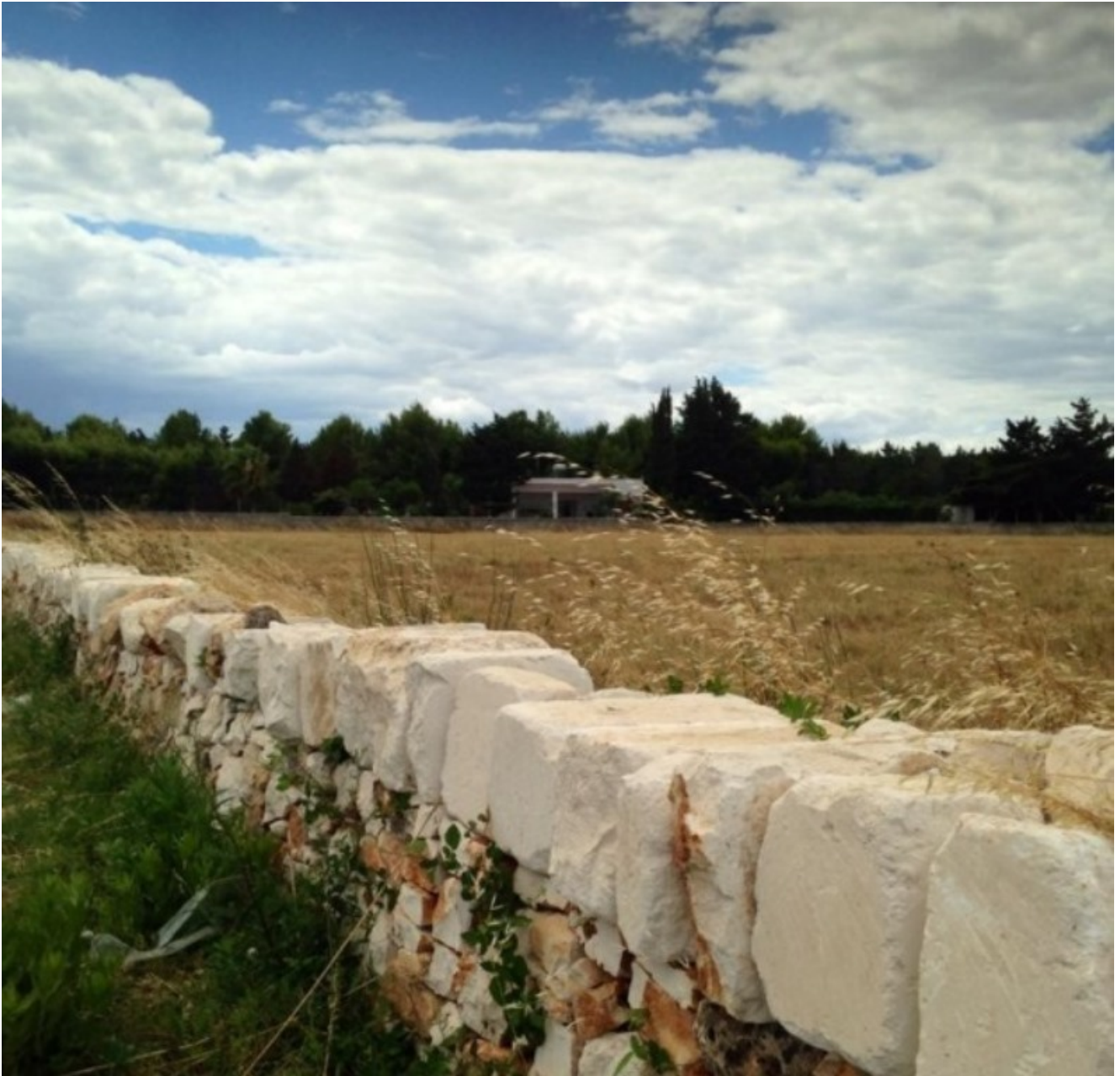
Muretti a secco