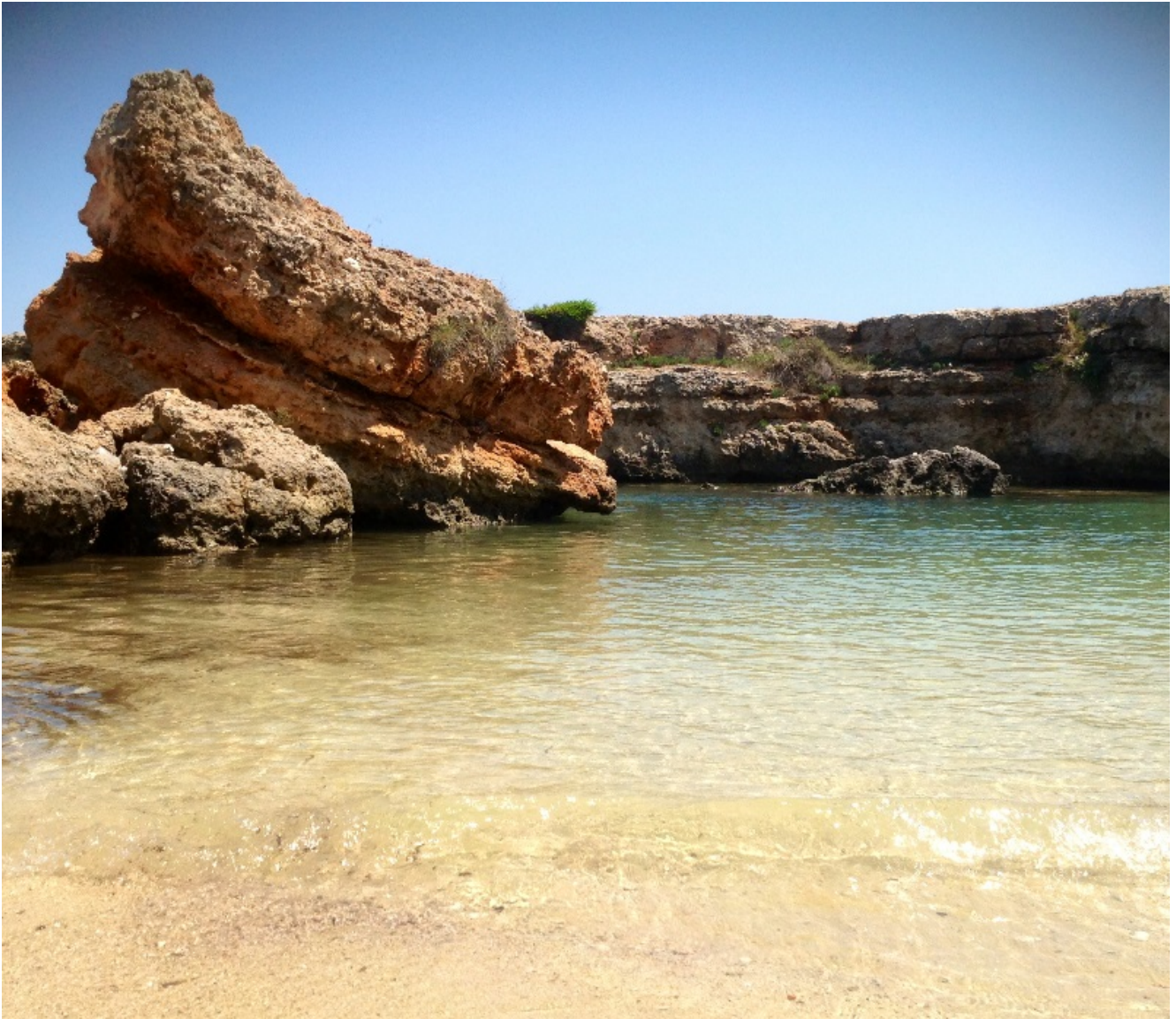
Torre Santa Sabina

E' in questa terra che ho passato le mie ultime vacanze, tra Taranto Bari e Brindisi.