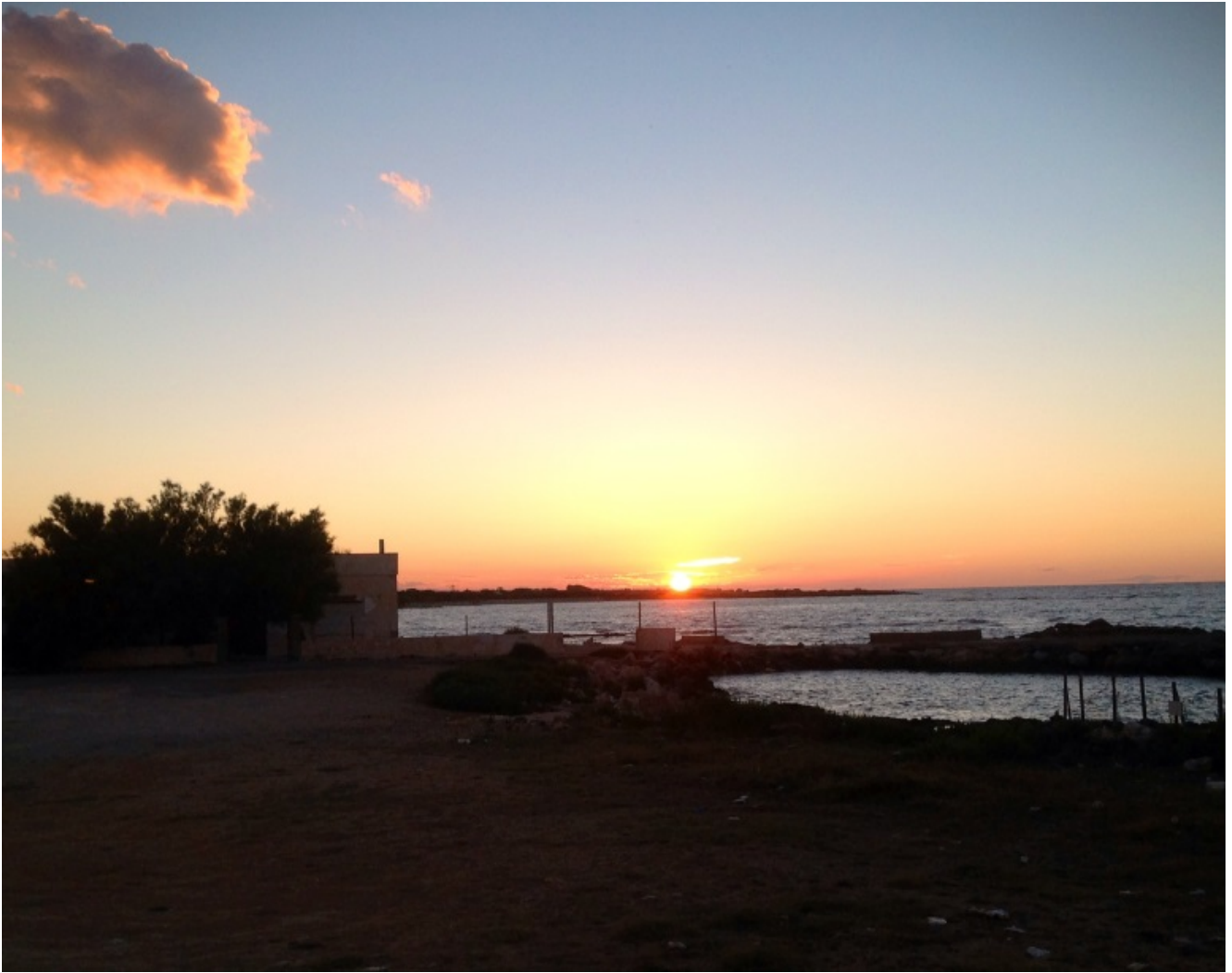
Il tramonto a Specchiolla