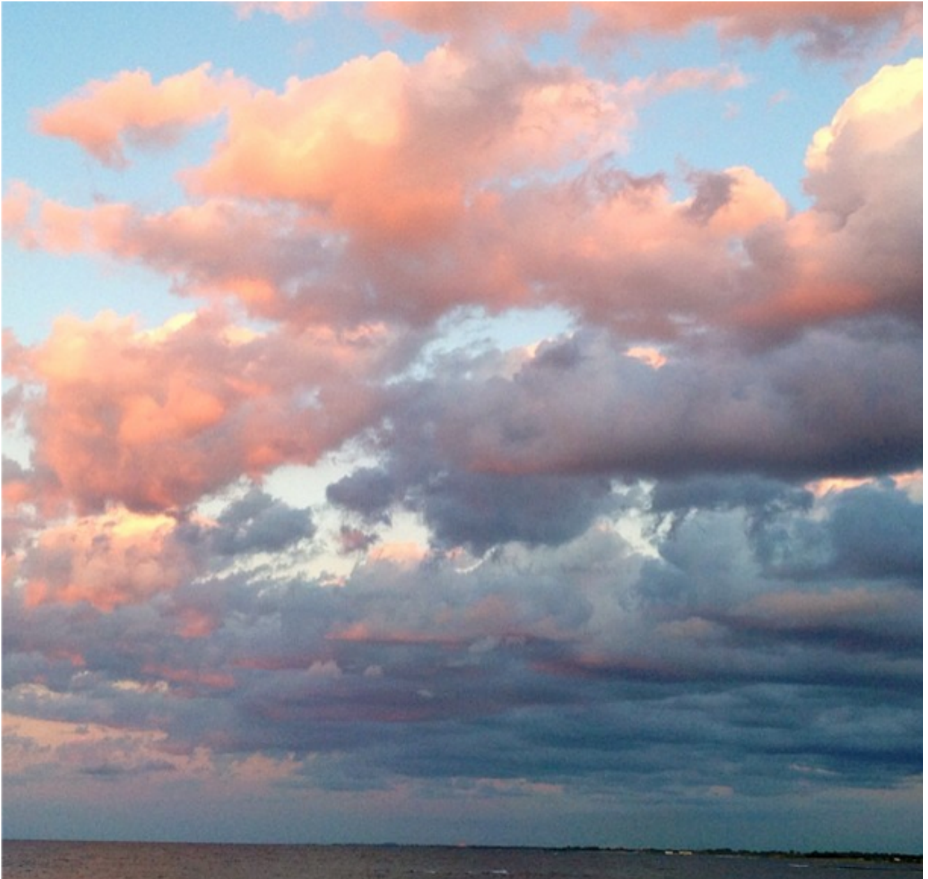
Le nuvole tinte di rosa a Torre Guaceto