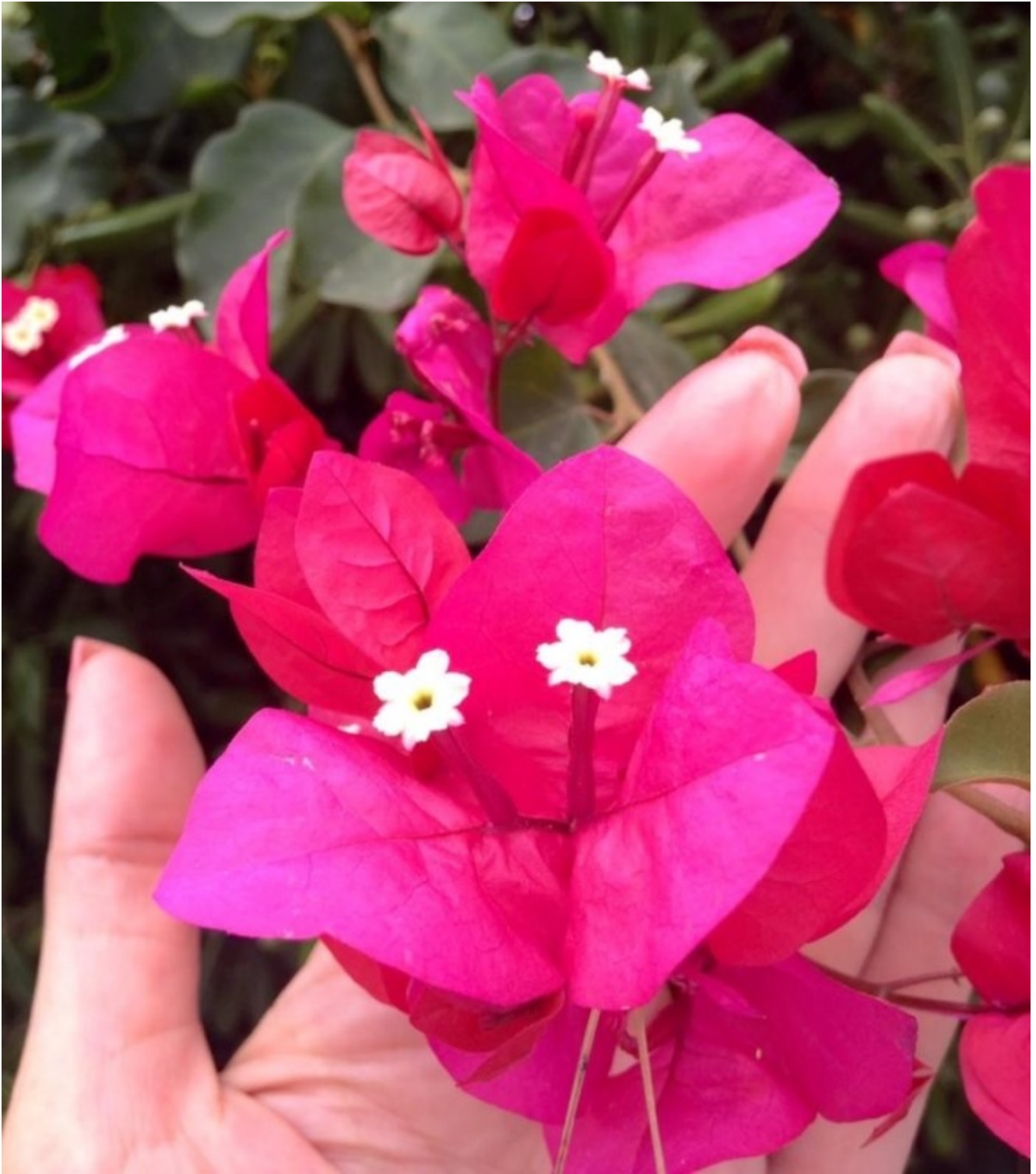
Fiori di Brindisi