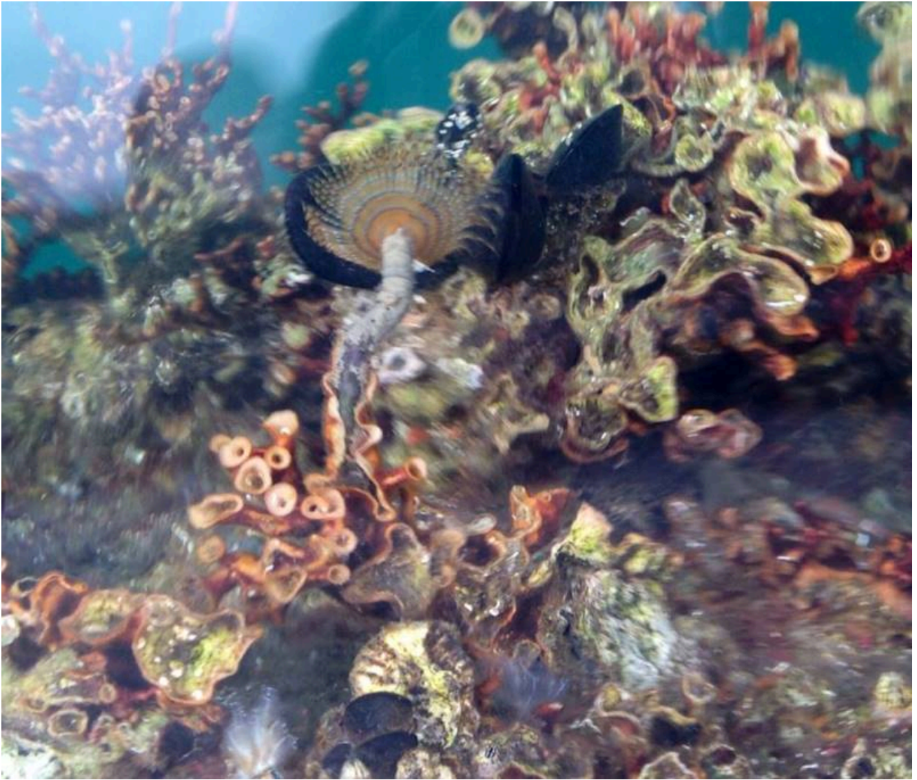
Corallo presso il Molo Sant'Eligio a Taranto. Effetti del cambio delle temperature che fanno riflettere...