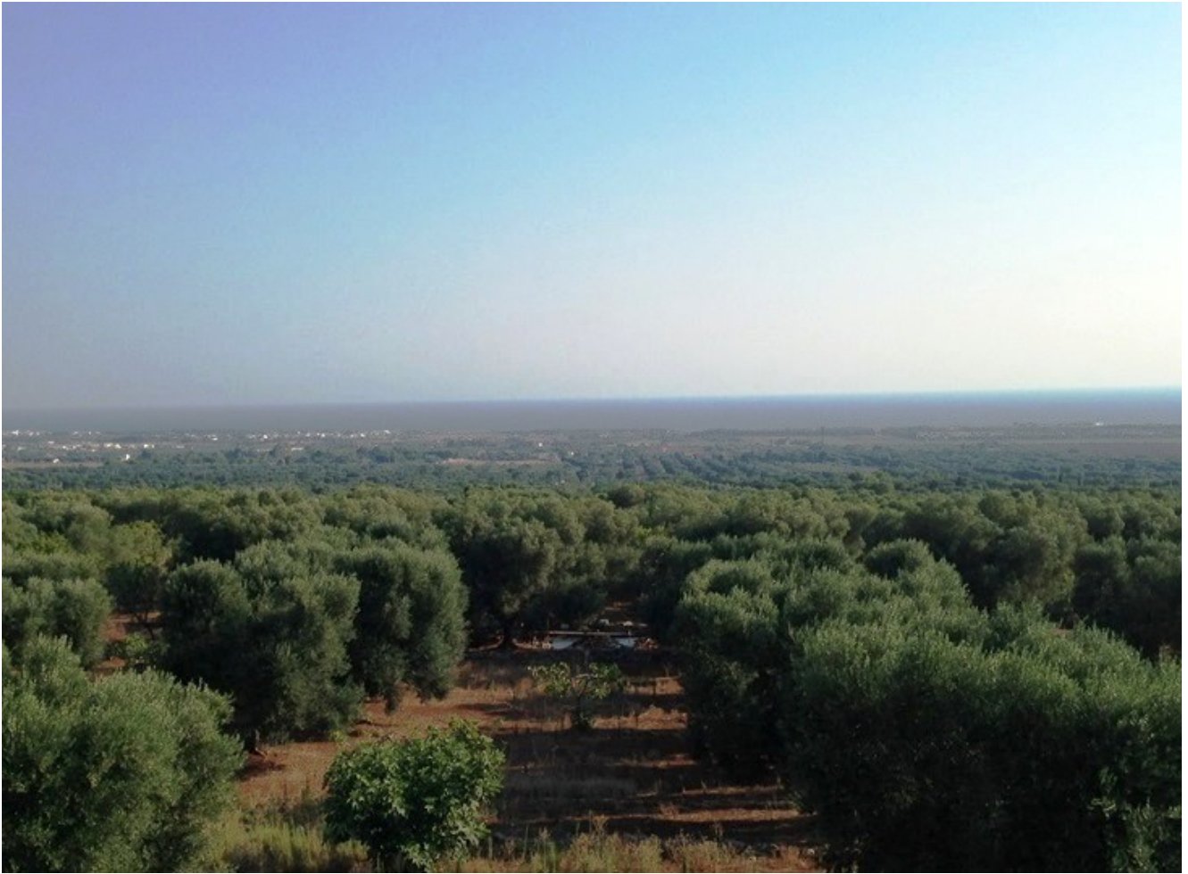
Uliveto a Carovigno