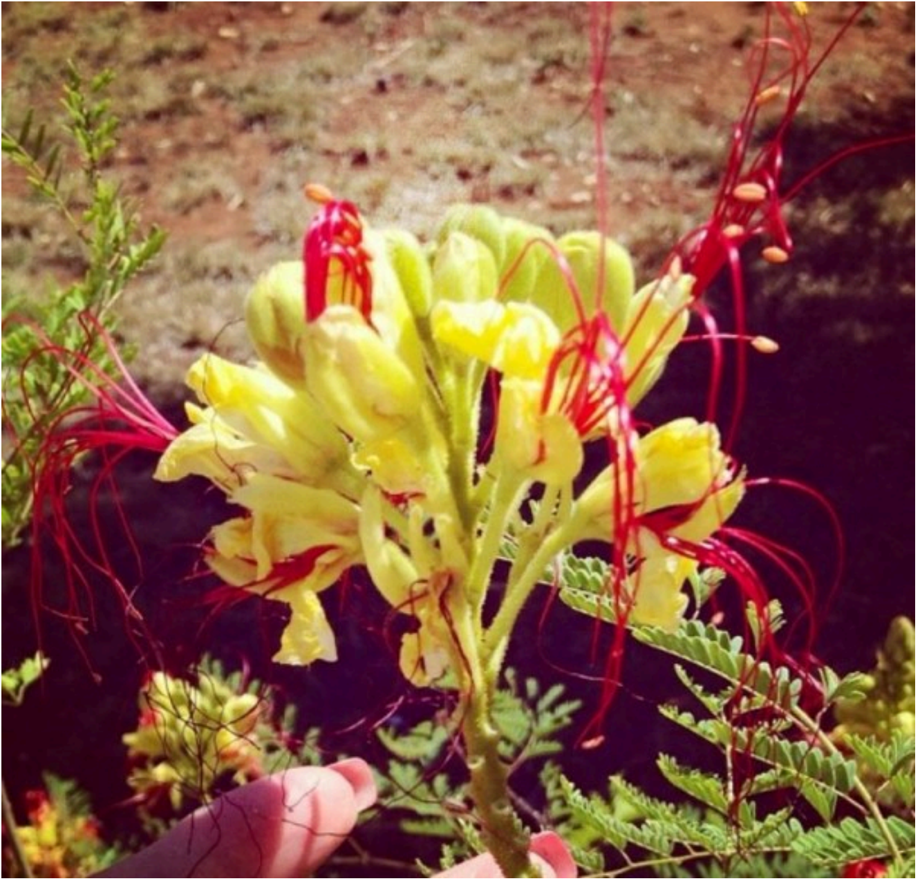
Fiori di Brindisi