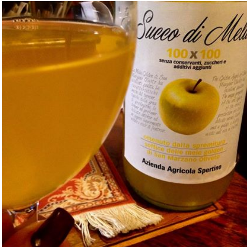
Succo di Mele Azienda Agricola Spertino