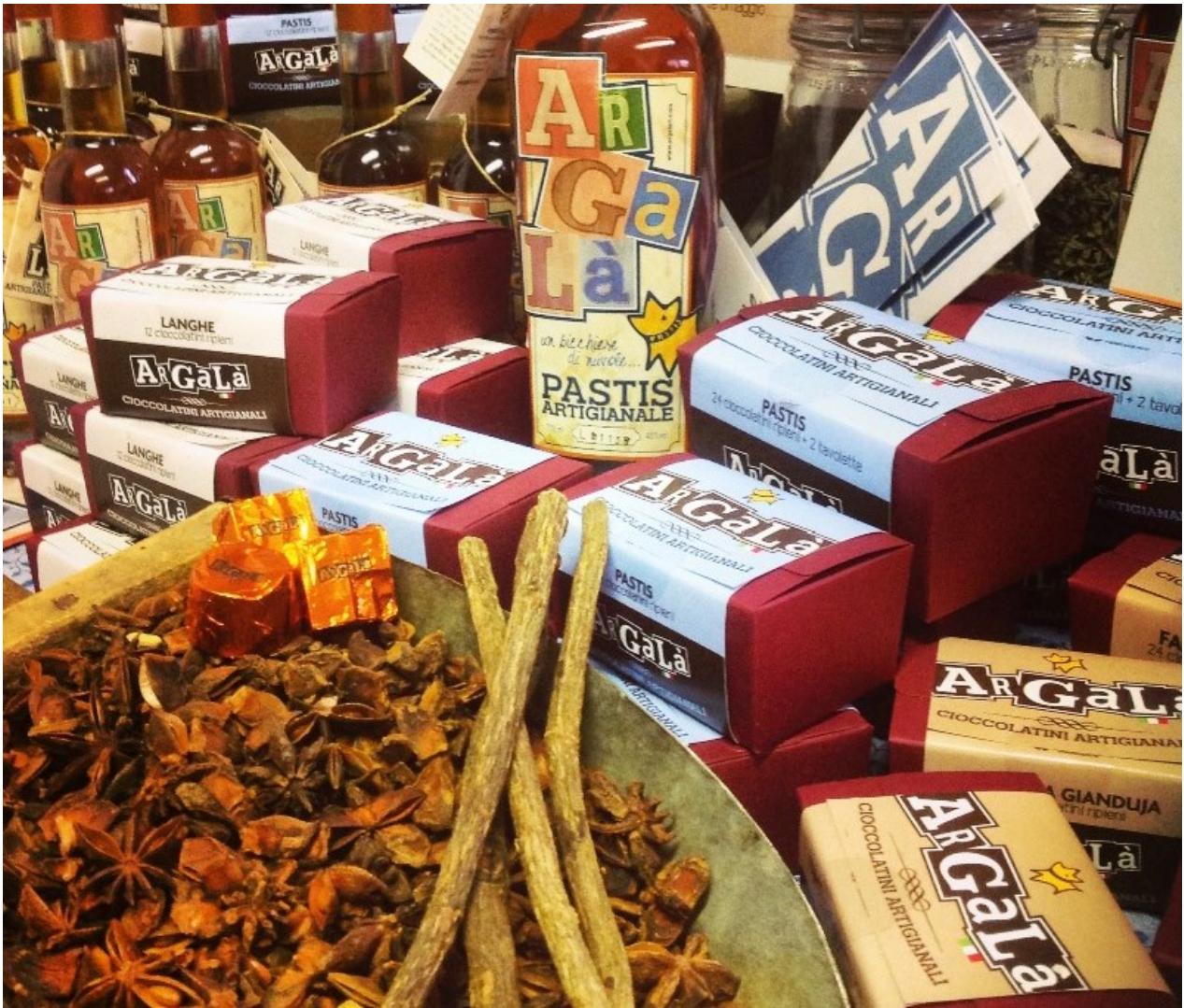
Pastis artigianale Argalà

Passeggiando tra gli stand ho visto cassette colme di mele gialle. Adorando la frutta ne ho chiesta una, e così ho fatto merenda. Una mela del frutteto dall'azienda agricola Spertino di San Marzano Oliveto, nel Monferrato. Una realtà familiare di cinque ettari che produce un ottimo succo di mele senza aggiunta di zuccheri, conservanti ne additivi.