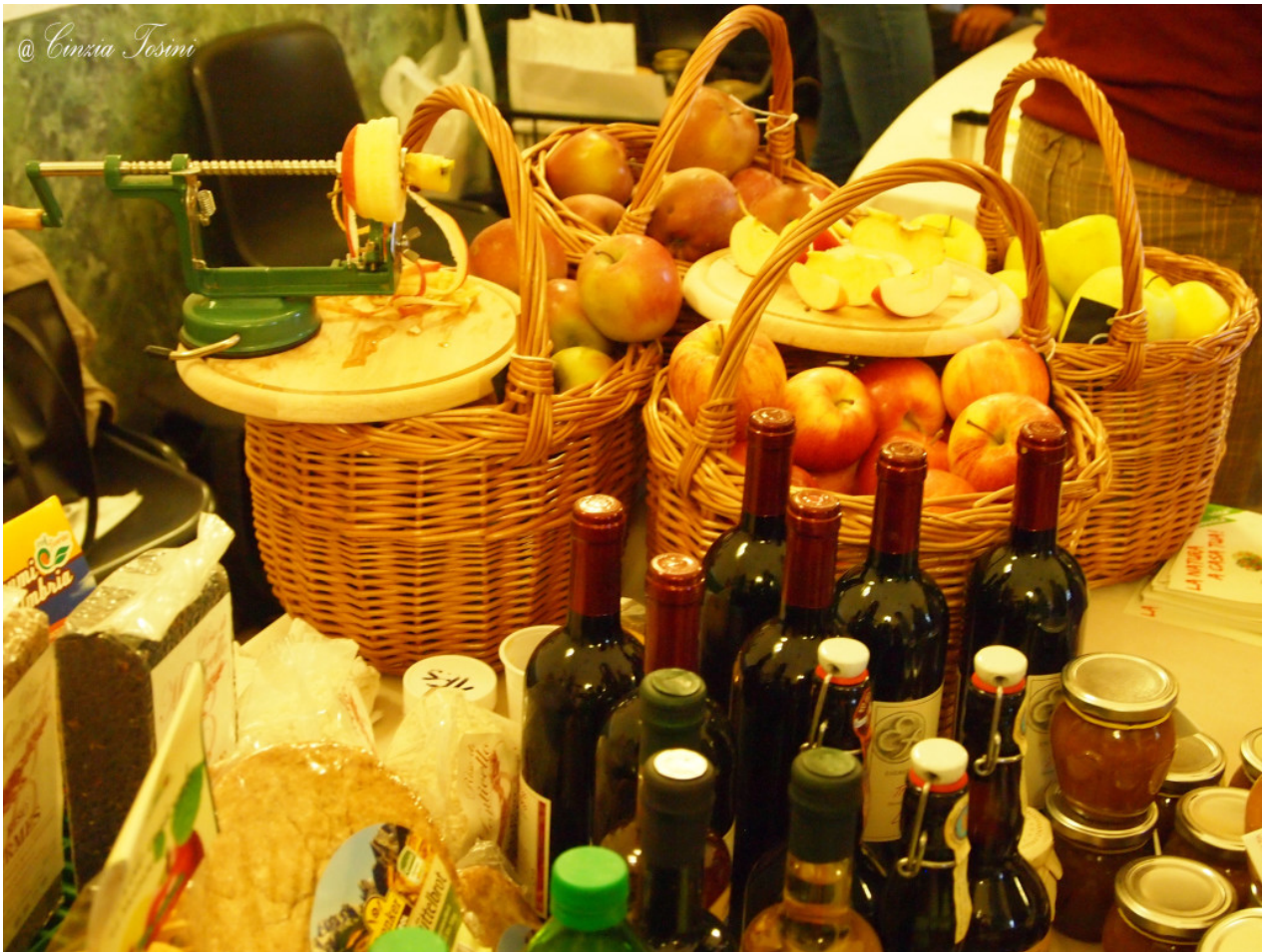
Il Frutteto del Parco di Ceriano Laghetto (MB)

Lo sapevate che la coltivazione dello zafferano è limitata a circa 25 ettari in Sardegna, a 8 in Abruzzo, e in piccole superfici coltivate in Toscana, Marche, Umbria, Sicilia e Lombardia per un totale di circa 35 ettari? Ebbene si.