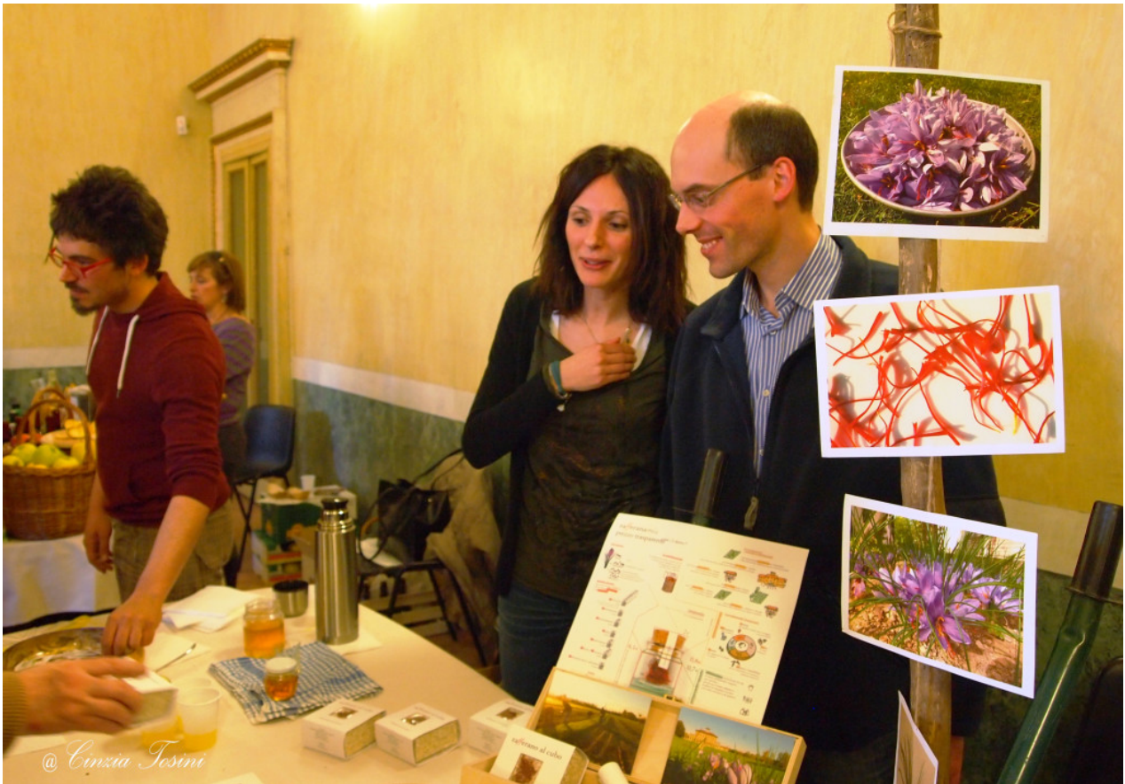
Zafferanami, società semplice agricola di Varedo (MB)

Anche a rischio di essere ripetitiva lo dichiaro ancora una volta: “Amo l’agricoltura e le aziende agricole!” Pensate che a Cesano Maderno, a poca distanza da casa mia, c’è l’ Azienda Agricola Villa Marina . Una realtà incentrata soprattutto sull’allevamento di razze autoctone in via d’estinzione. Una fattoria in cui potrete vedere i bovini di razza varzese, la pecora brianzola, la capra a quattro corna, cavalli da tiro, asini, muli, maiali, oche e pollame. Insomma, una meraviglia!