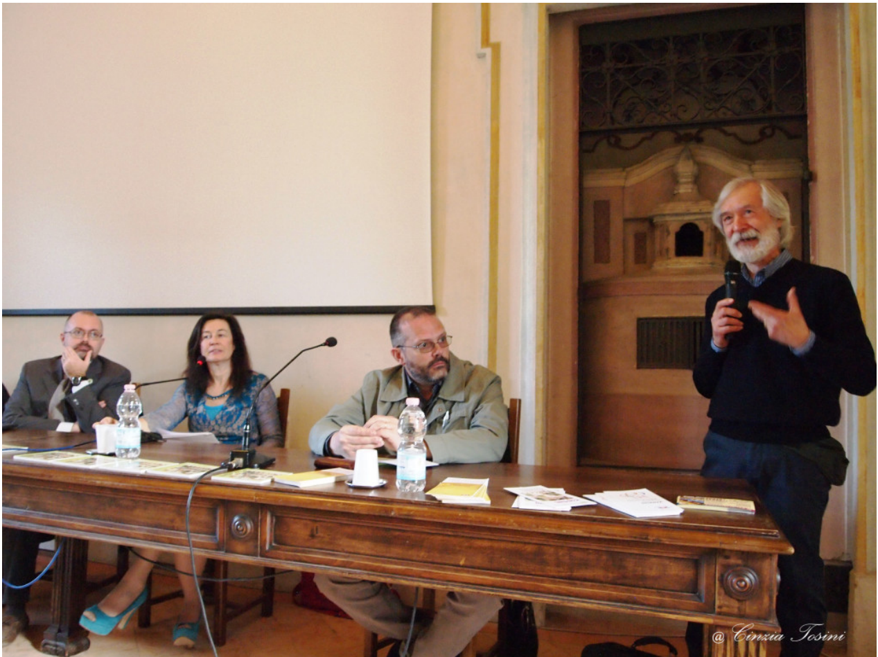
Tavola rotonda "I sapori di una volta e i sapori di oggi"