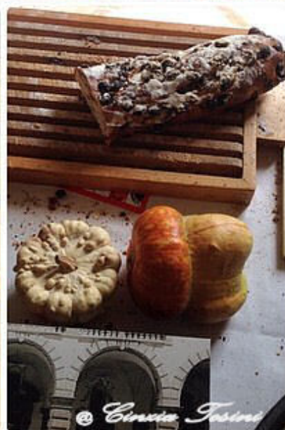
Il Fornaio di Cesano Maderno

Amo la frutta e verdura. A rappresentarla Il Frutteto del Parco , un'azienda agricola di ben 80 ettari all'interno del .Parco delle Groane