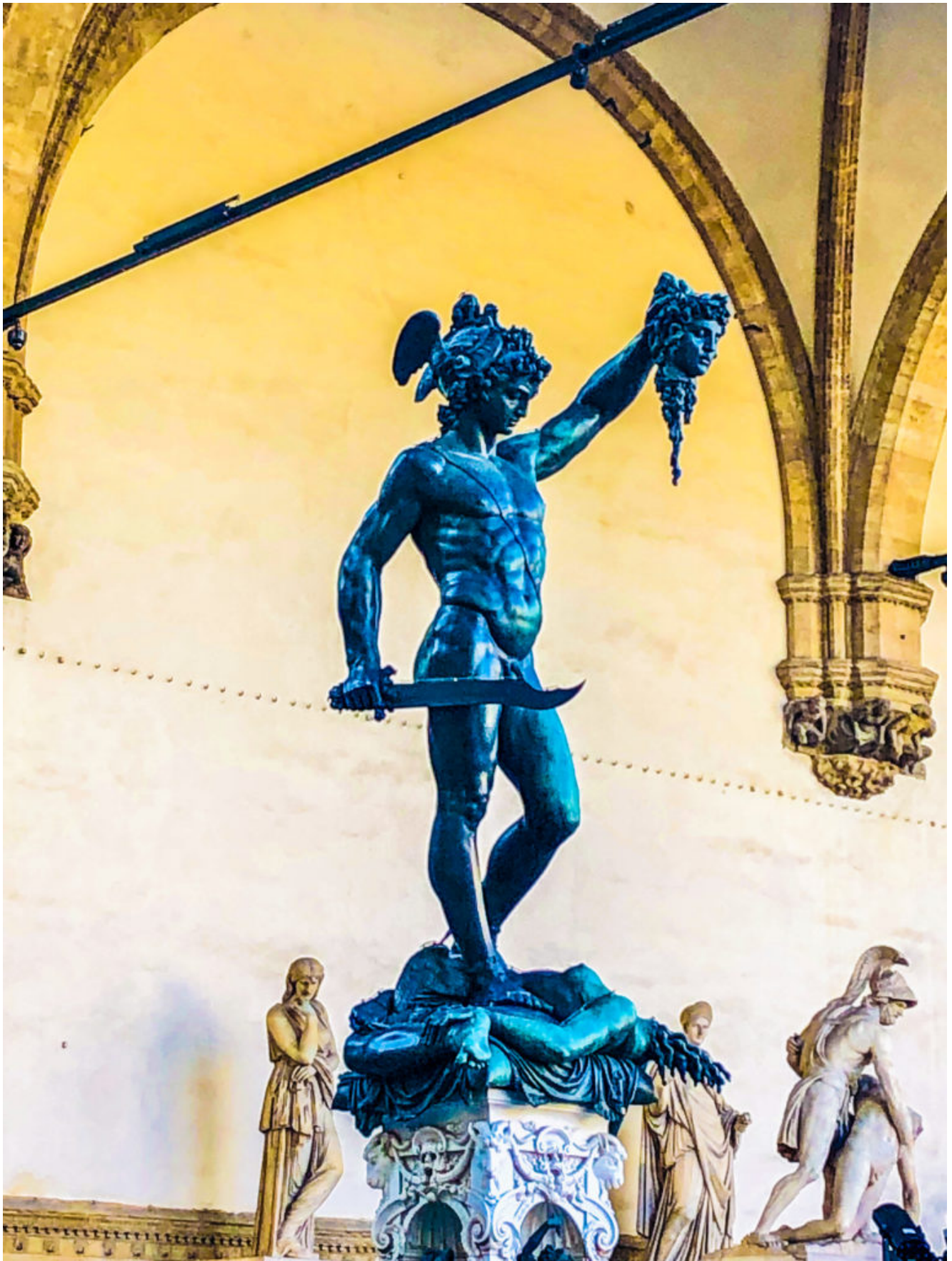
Il Perseo di Cellini