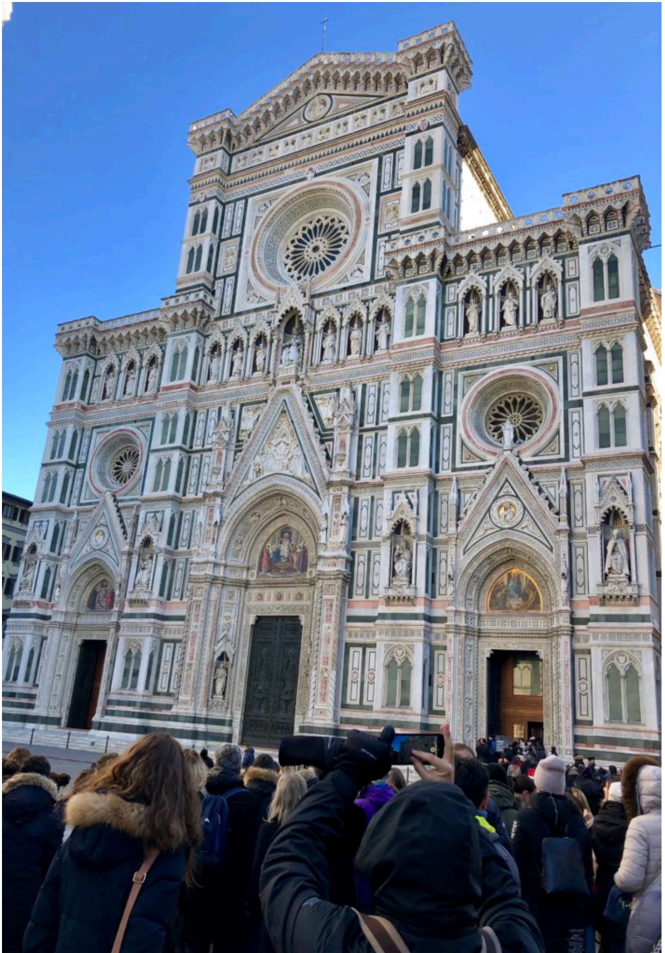
Il Duomo o Cattedrale di Santa Maria del Fiore, è la terza