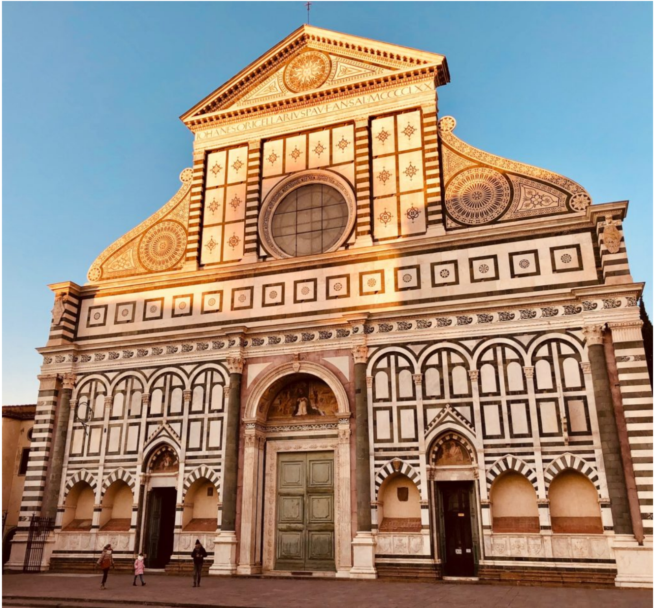
Santa Maria Novella

seconda dei mesi dell'anno. Una sorta di osservatorio astronomico.