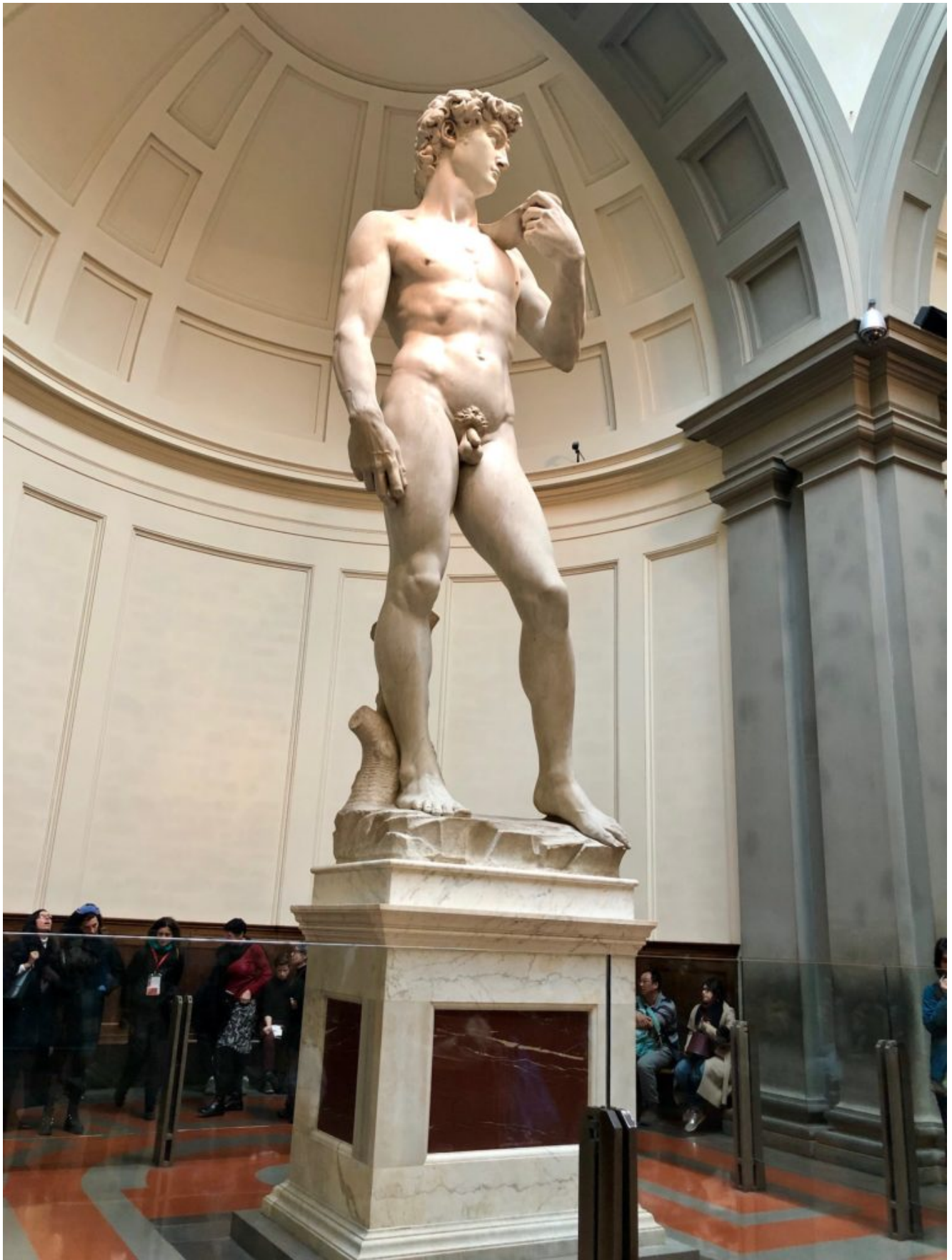
David di Michelangelo Buonarroti 1504 – marmo, altezza cm. 516,7