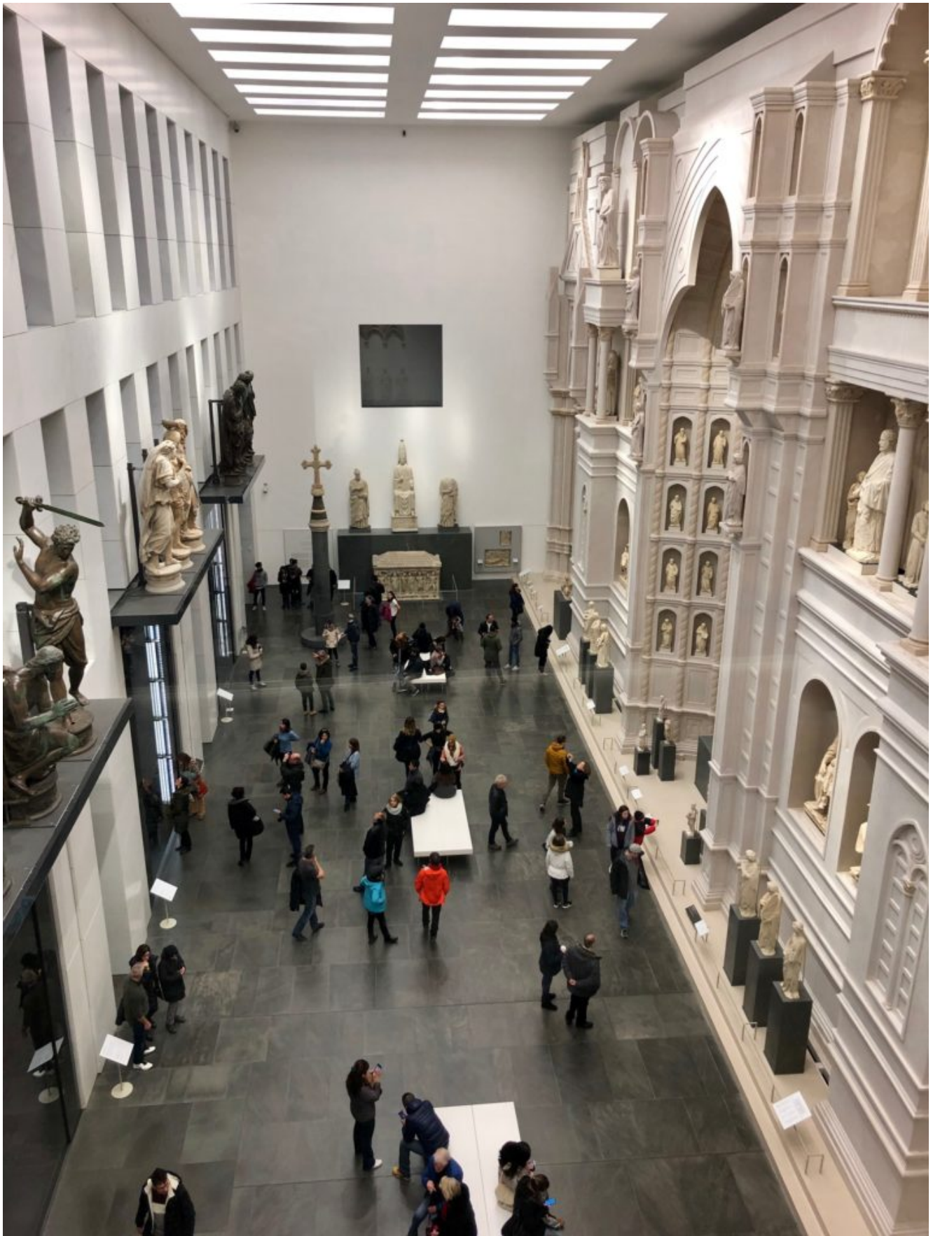
Museo dell'Opera del Duomo