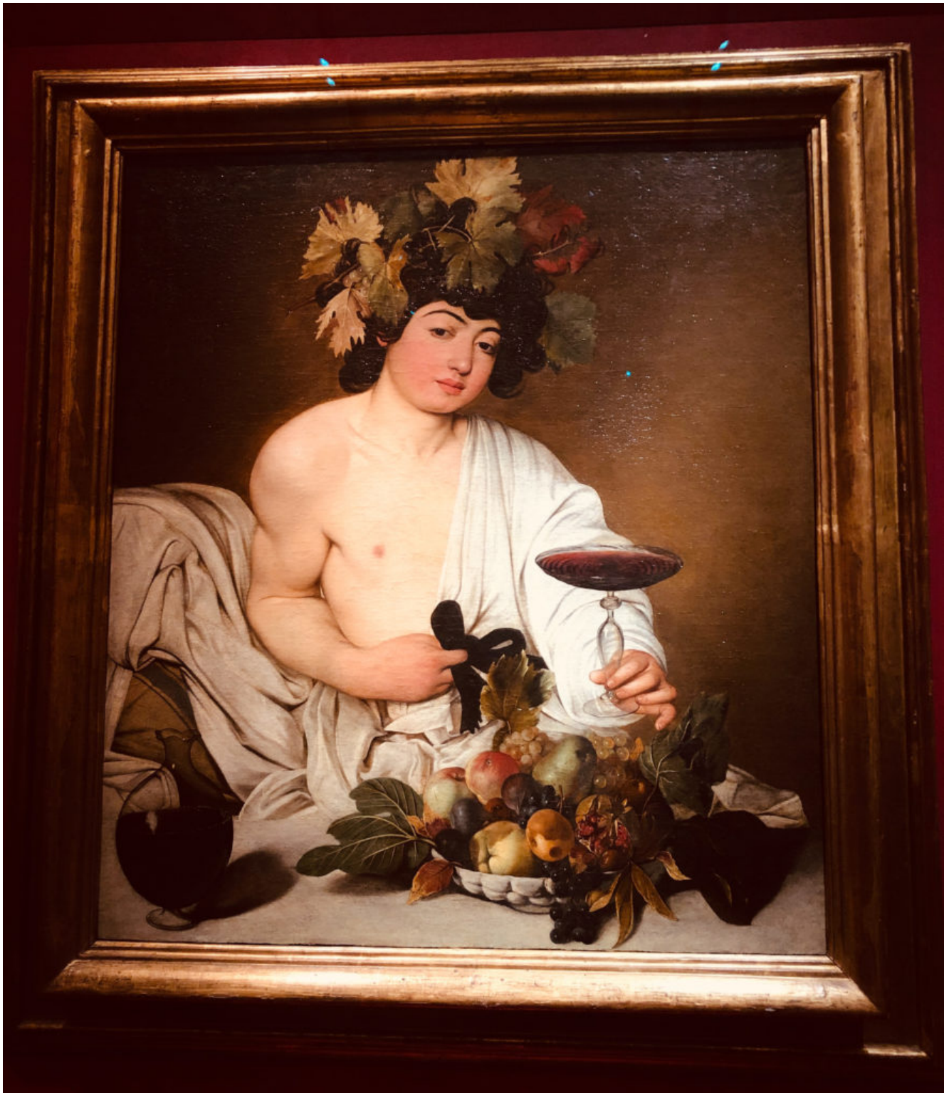
Bacco (1597-1598) di Michelangelo Merisi, detto il Caravaggio