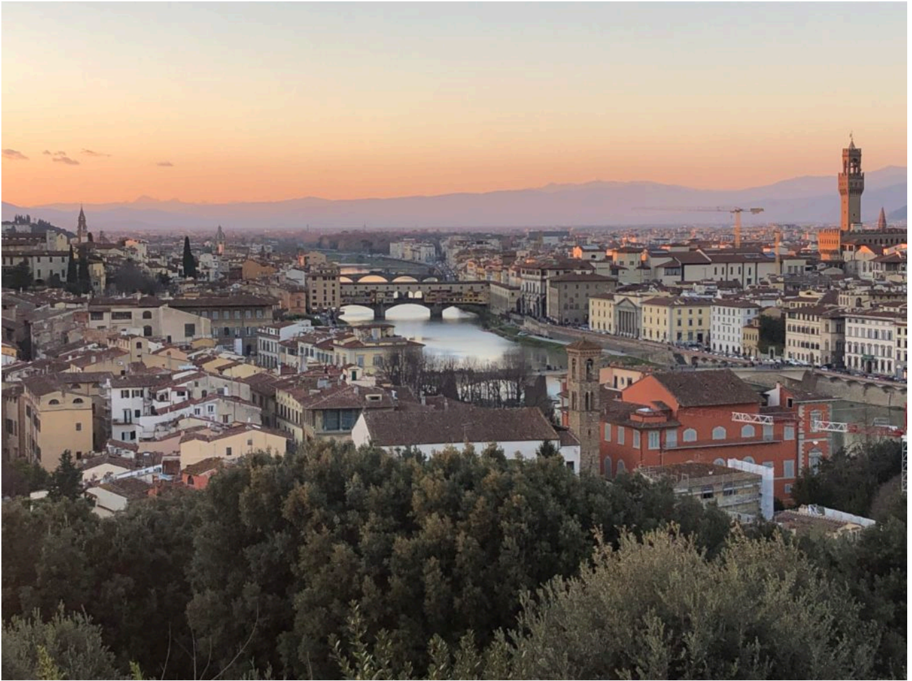
Vista da Piazzale Michelangelo