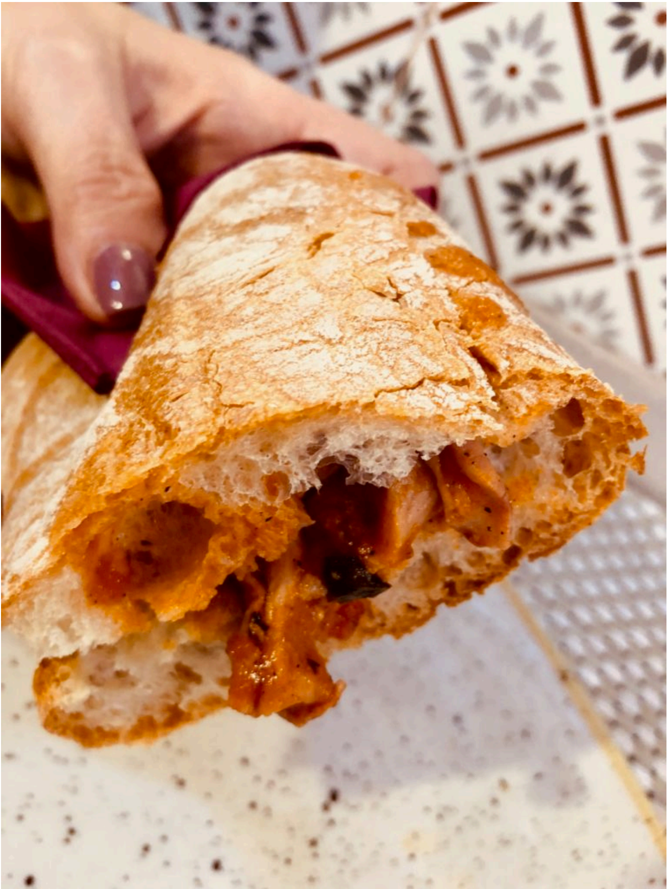
Panino al Lampredotto