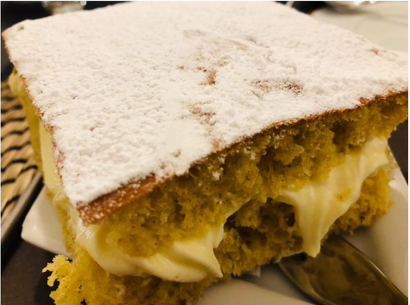
Schiacciata alla fiorentina

unta per l'uso dello strutto nell'impasto. Un dolce a lenta lievitazione al profumo di arancia tipico di carnevale, che in realtà si prepara tutto l'anno. Davvero delizioso!