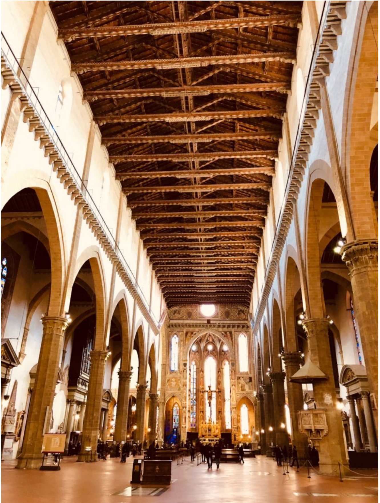
Santa Croce – 1385