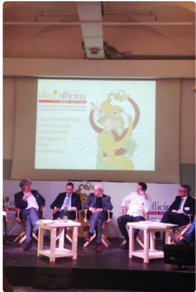
La gestione dell'olio al ristorante