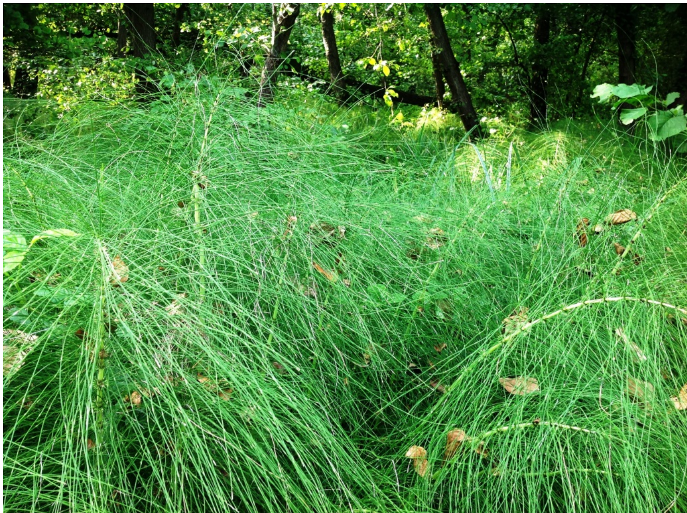
Azienda Agricola San Massimo (Loc. San Massimo – Gropello Cairoli (PV