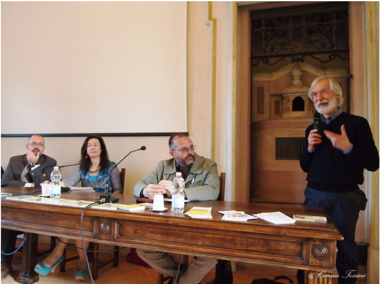
Tavola rotonda "I sapori di una volta e i sapori di oggi"