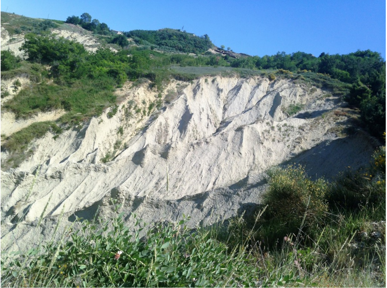
Oasi WWF Calanchi di Atri

Si è conclusa così la mia vacanza in Abruzzo, un viaggio di conoscenza e di solidarietà tra sapori, natura, storia e bellissimi paesaggi. Cinque giorni vissuti in una terra insieme alla sua gente. Luoghi e persone che mi hanno rapito il cuore.