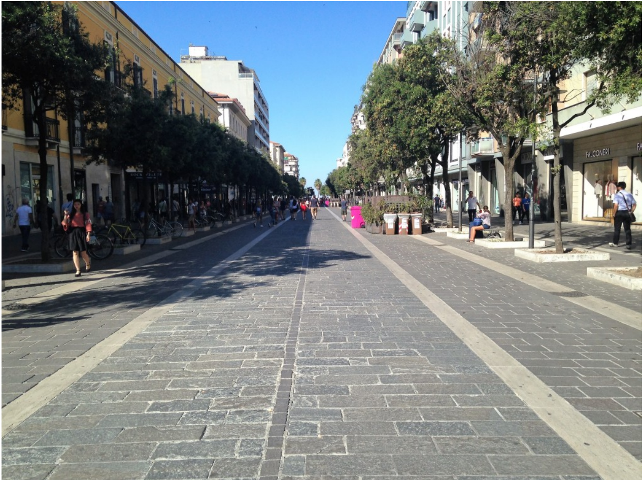
Corso Umberto, Pescara