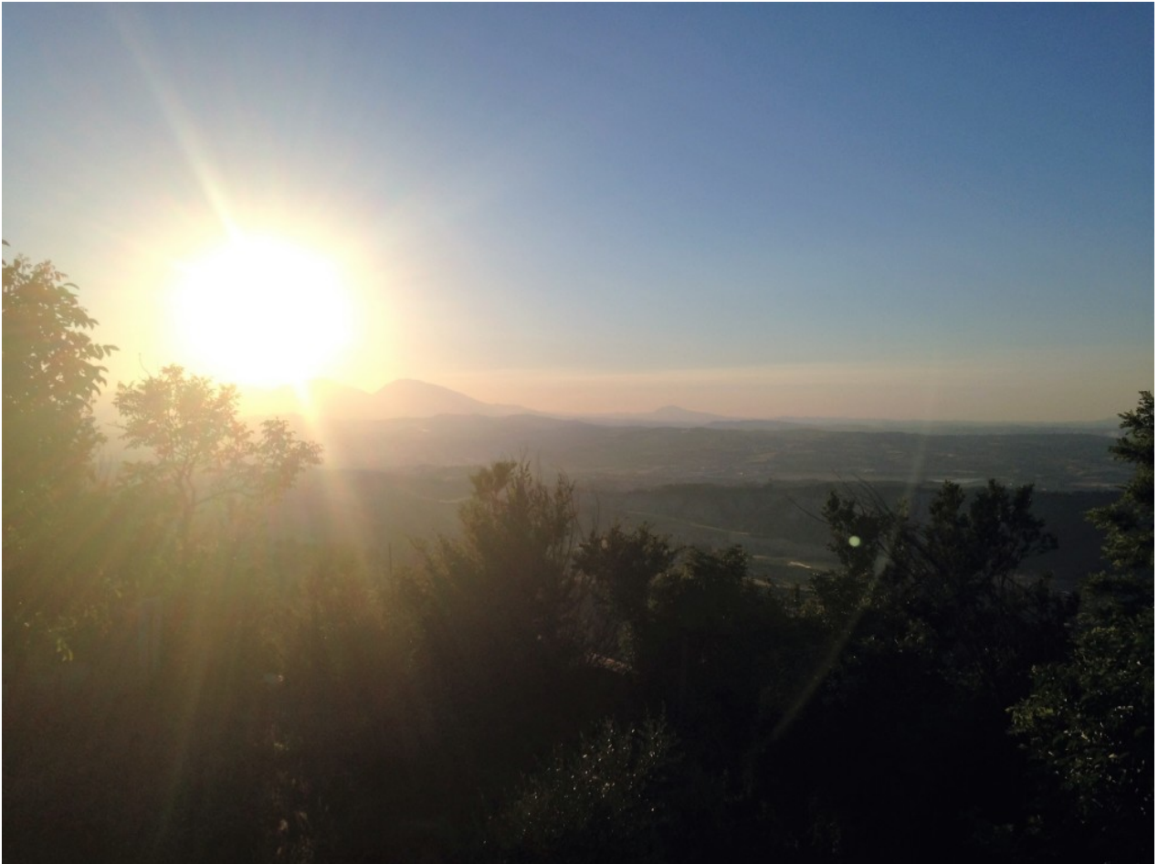
Vista da Pineto