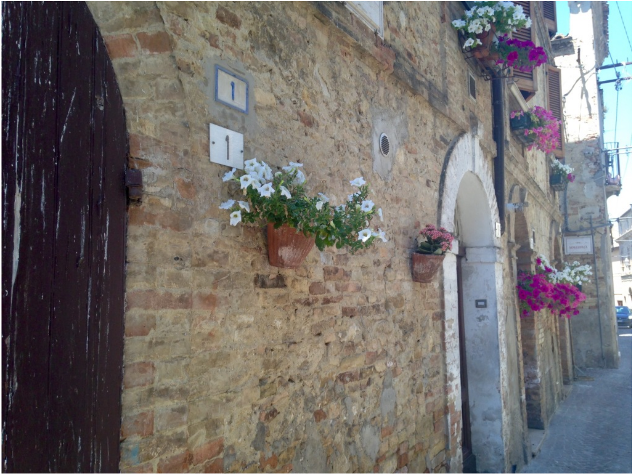
Vicoli di Atri