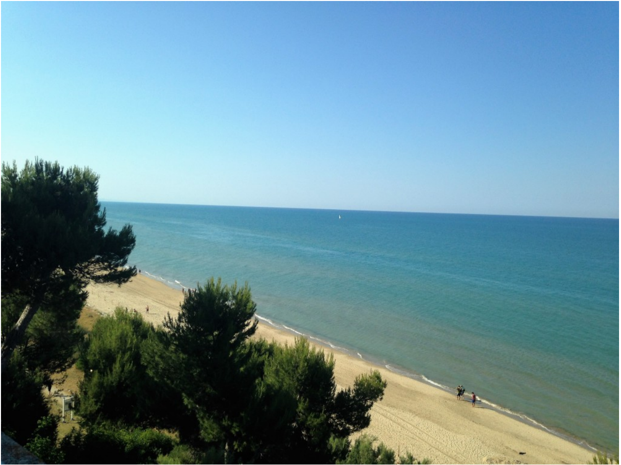
Spiaggia di Pineto