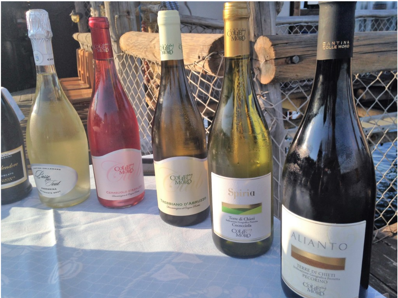
Vini Cantina Colle Moro