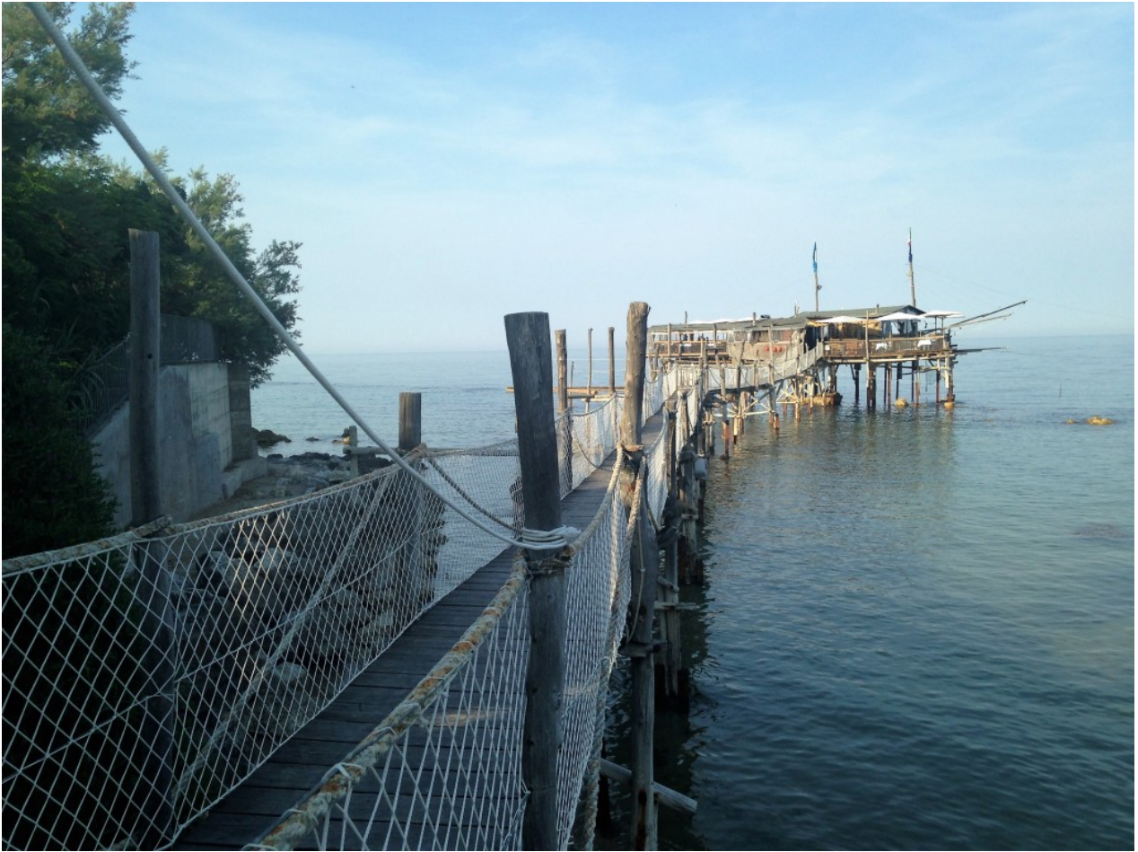
Trabocco Pesce Palombo