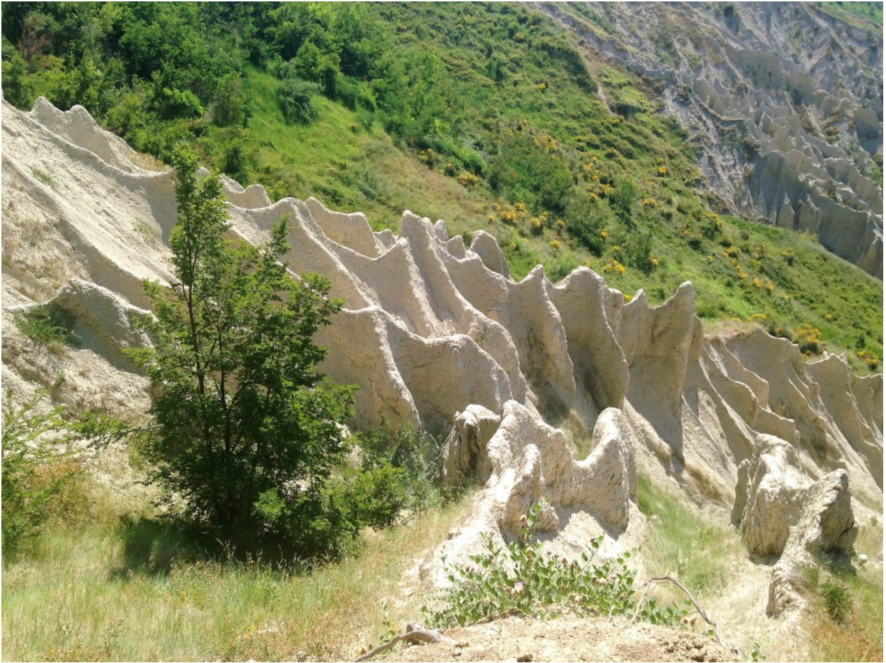
Riserva Naturale dei Calanchi di Atri