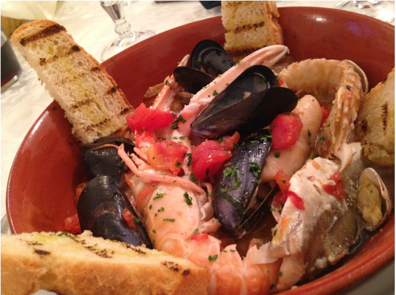
Brodetto di pesce alla Pinetese