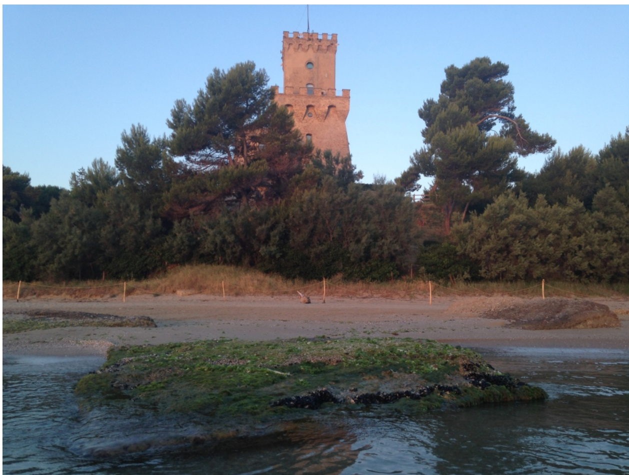
Torre del Cerrano

Hatria. E' situata in un ambiente ricco di biodiversità con un habitat di elevato valore floro-faunistico. Sito di Interesse Comunitario, ospita il centro visite e il Museo del Mare.