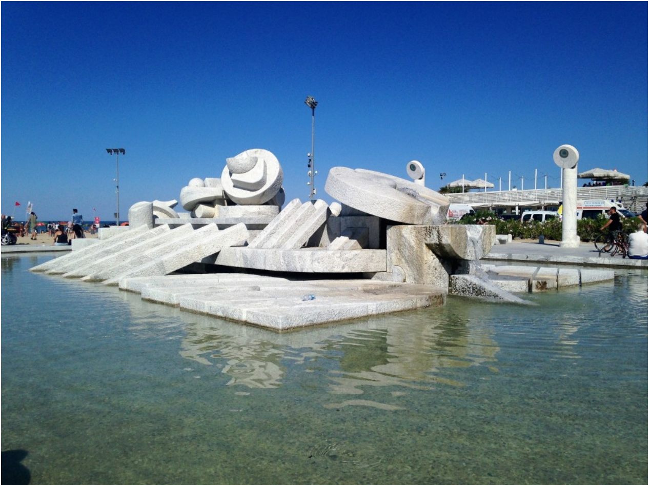
La fontana "La Nave" di Pietro Cascella