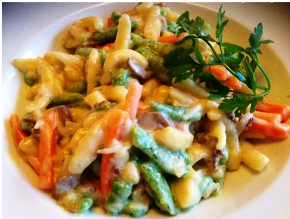
Spatzli con panna e verdure

acqua. A volte, in sostituzione di quest'ultima, si utilizza la birra.