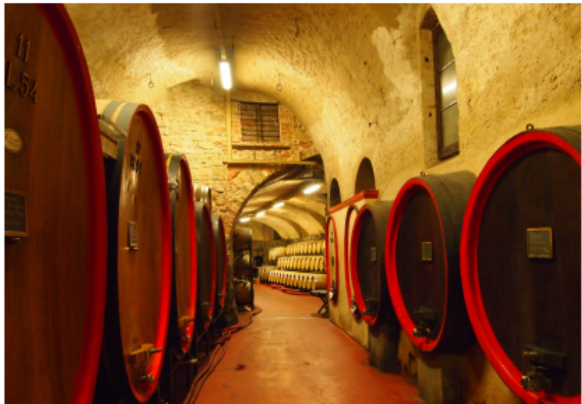
Tenuta Castello di Grumello