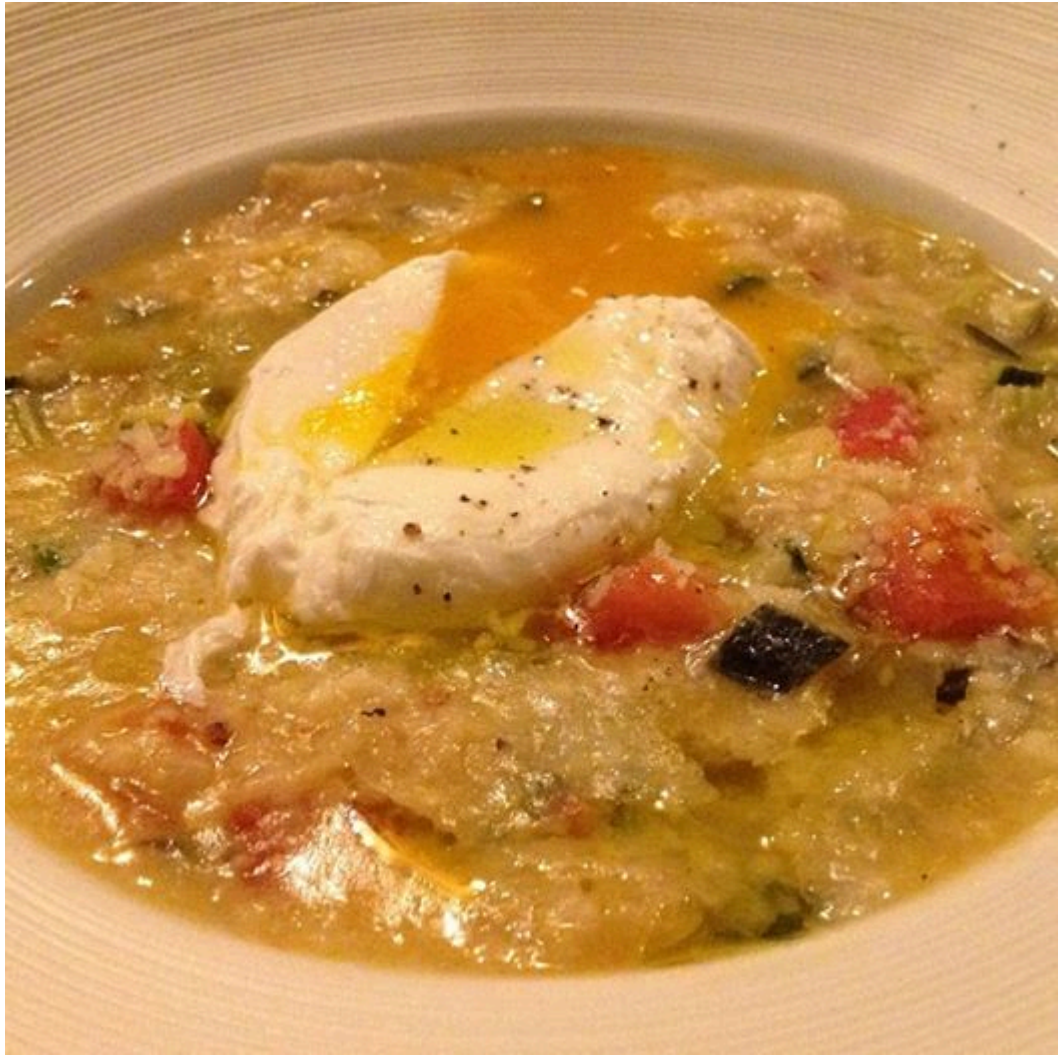
(Pancotto alle verdure con uovo pochè (uovo in camicia