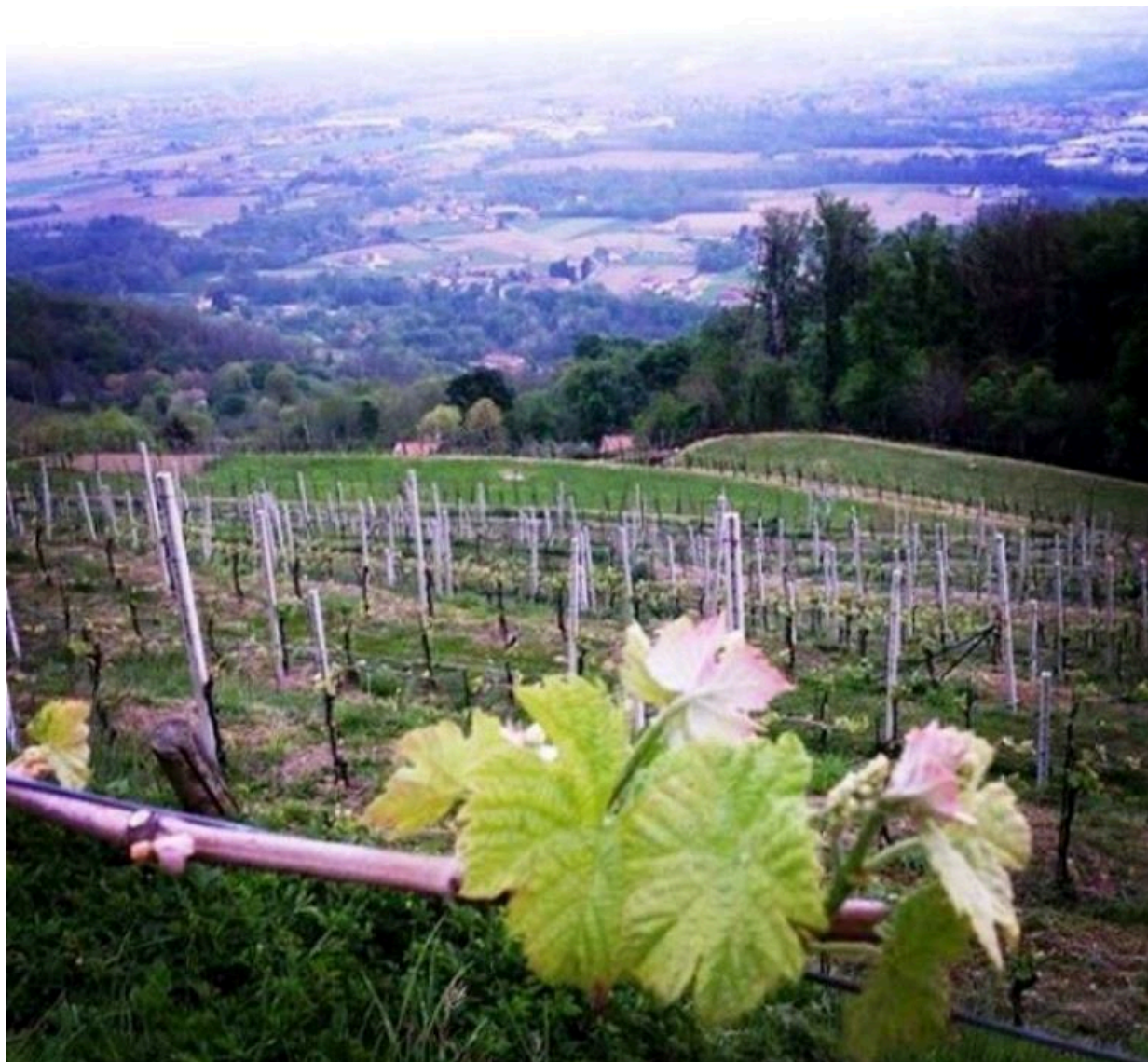
Ronco di Sera

Tre ettari di vigneti e uno di oliveto da cui produce olio extra vergine di oliva da cultivar Frantoio, Casaliva, Leccino e Pendolino , e il vino che porta sulle tavole del suo agriristoro biologico. Ronco di Sera , prodotto con un taglio di vino Merlot variabile tra il 60-70% e Cabernet Sauvignon per la rimanente parte, Tessére ottenuto da uve Merlot, Turano da uve Cabernet Sauvignon , e infine Marinele , .da uve Moscato giallo