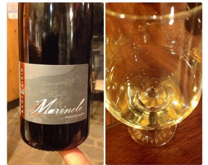
Moscato Giallo J.G.J. Sant'Egidio