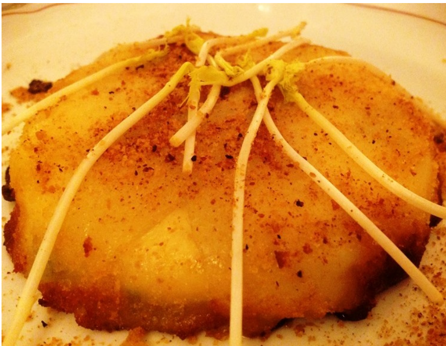
Tortino di patate con mozzarella fiordilatte, gorgonzola naturale e polvere di panettone