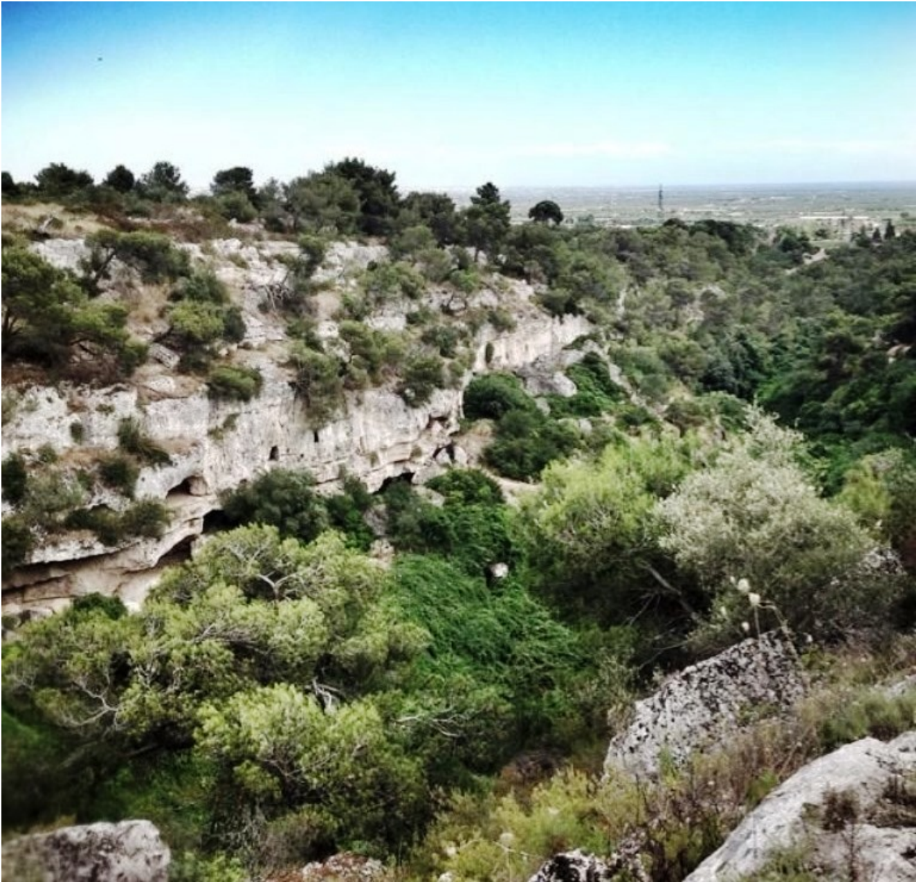
Gravina di Mottola