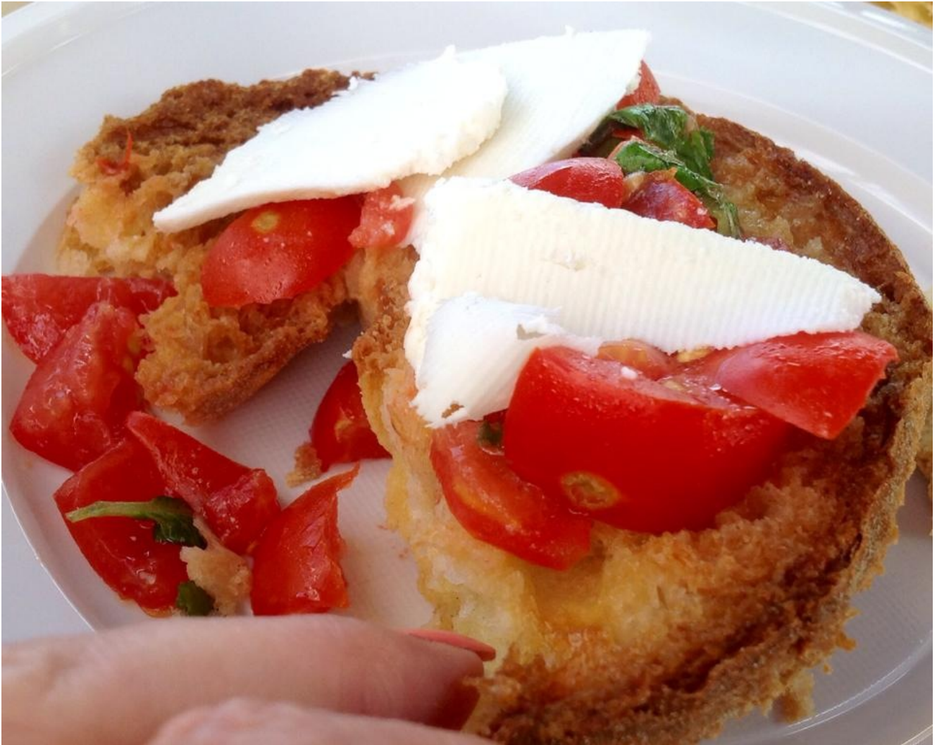
Friselle all'acqua di mare