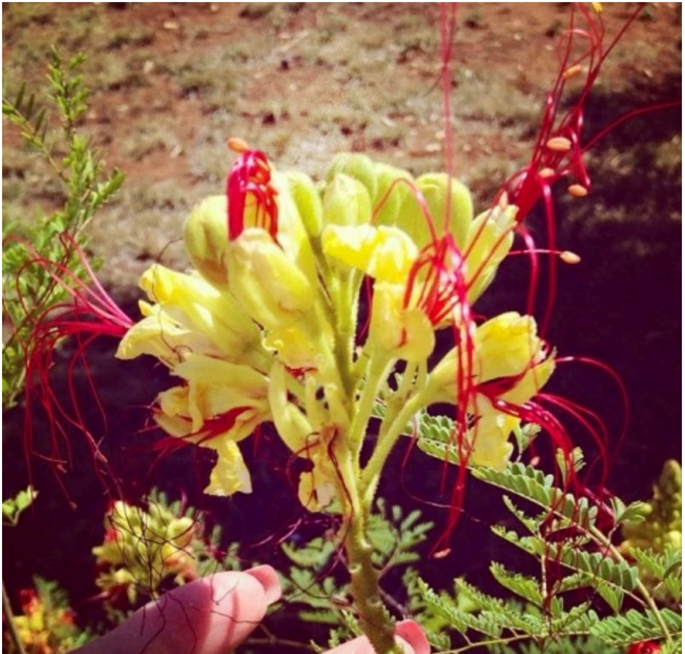
Fiori di Brindisi