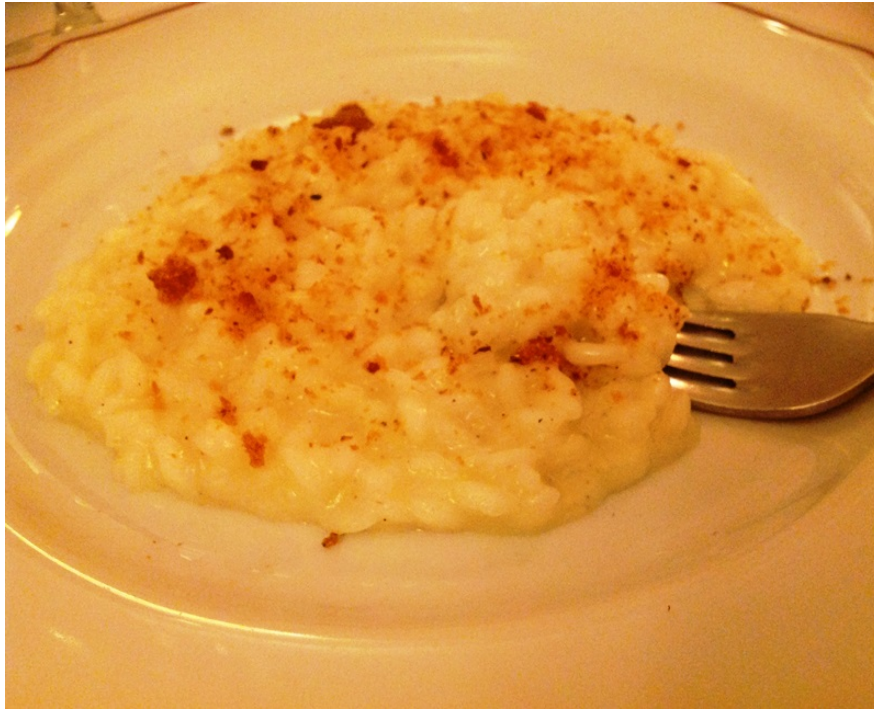
Carnaroli mantecato al Franciacorta con briciole di panettone al mandarino