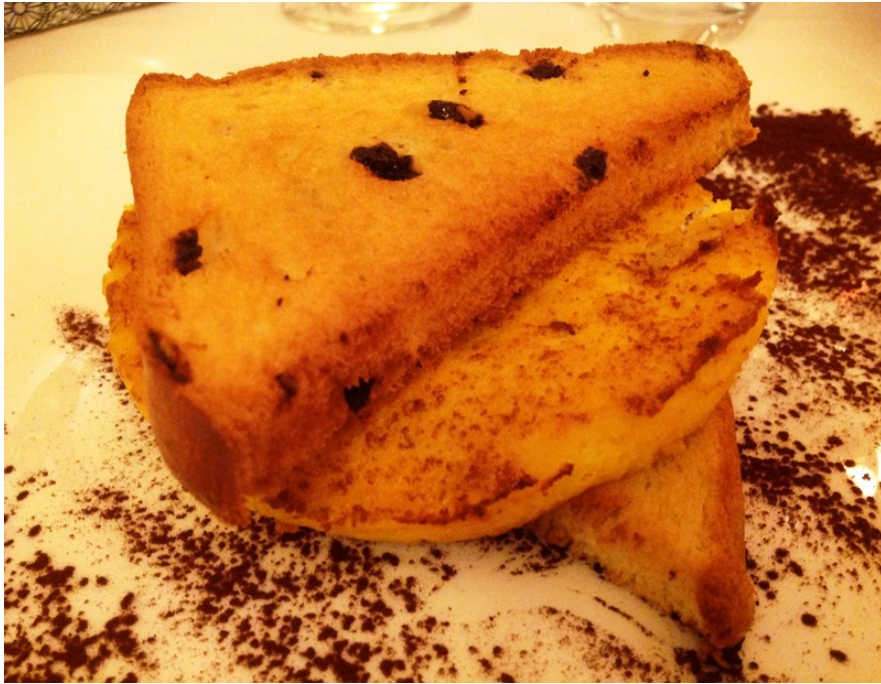
Omelette dolce con succo d'arancia e pan brioche al cioccolato