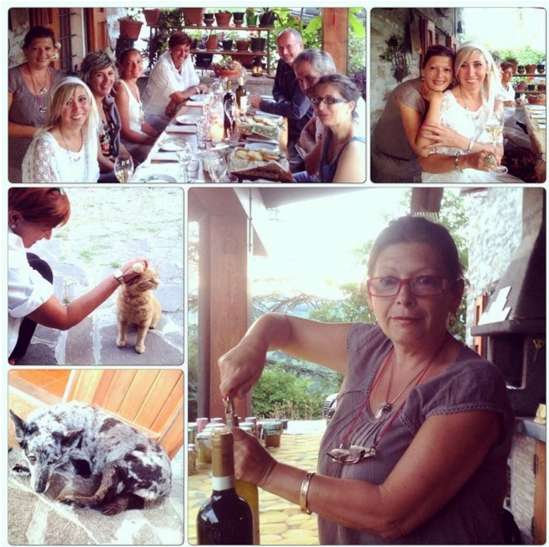
Cena inaugurale dell'Associazione Culturale Casa Rangoni