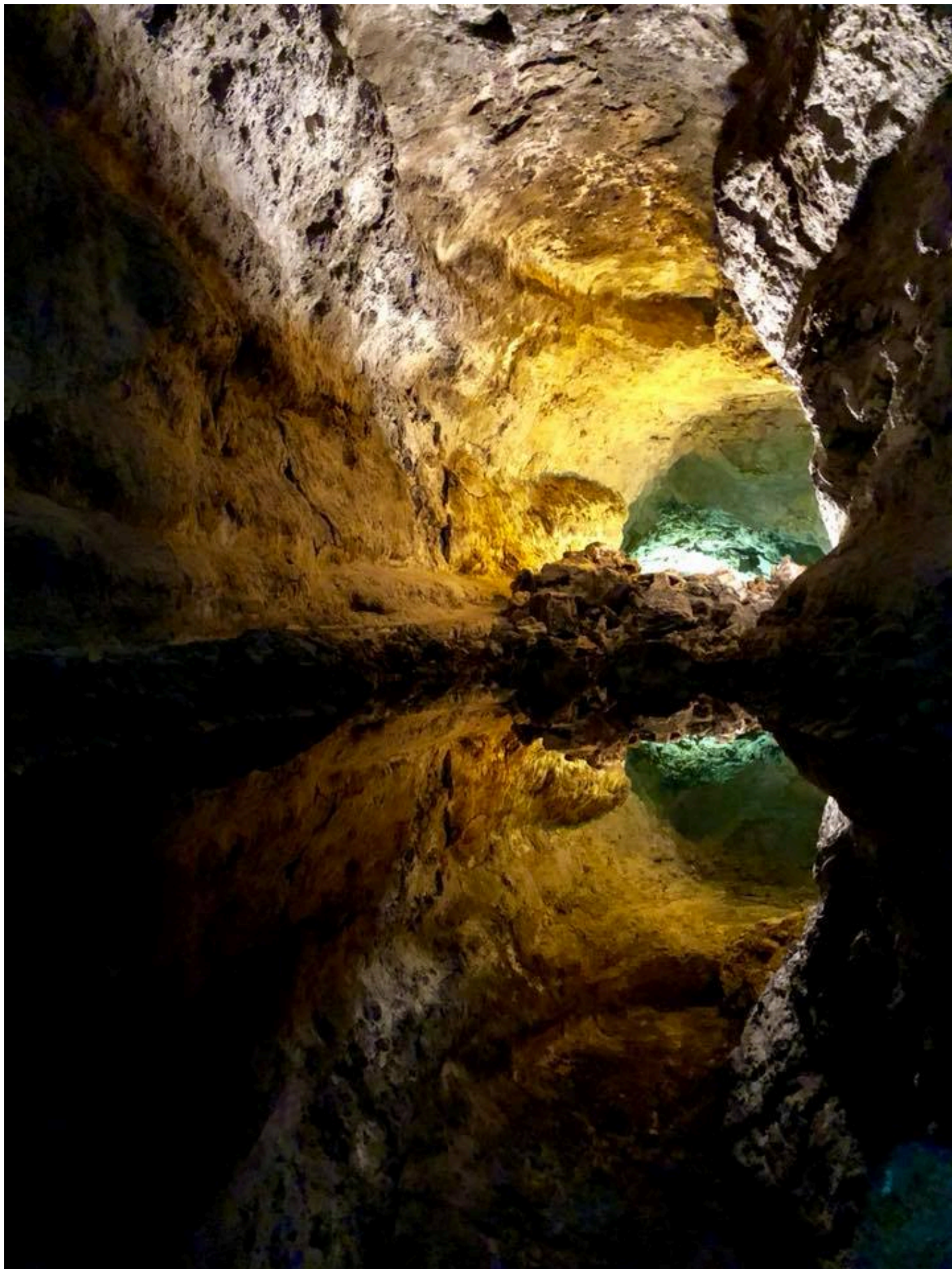
Playa del Papagayo