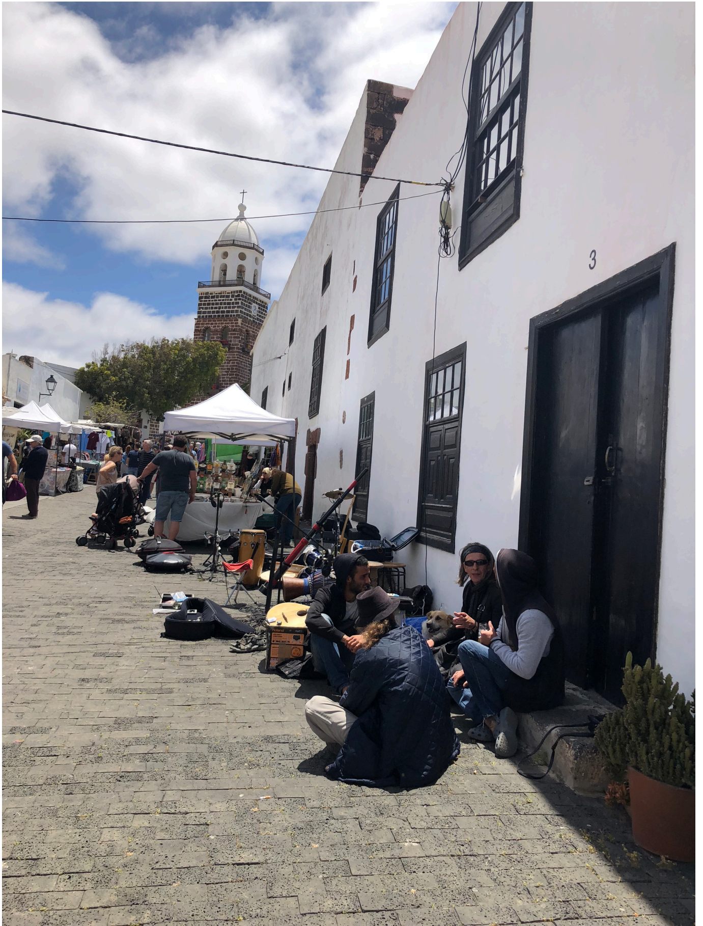
Mirador del Rio