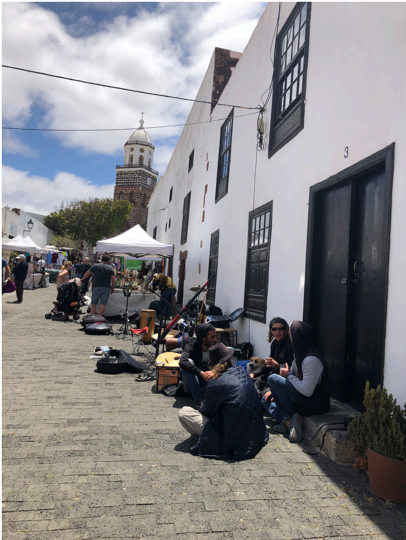
Mirador del Rio