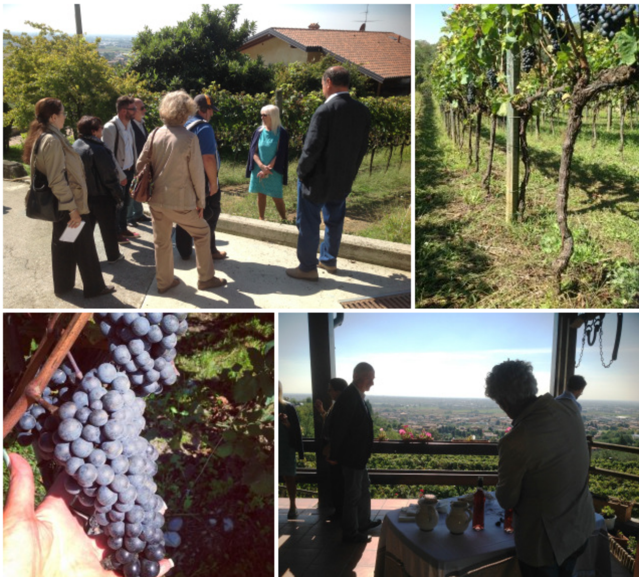
Tenuta Le Mojole